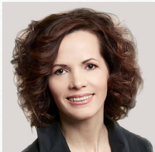
КАДЫРОВА ГУЛЬНАЗ МАННУРОВНА Заместитель Министра

Образование Высшее, в 1987 г. с отличием окончила Казанский финансово-экономический институт, факультет «Планирование промышленности», экономист Доктор экономических наук