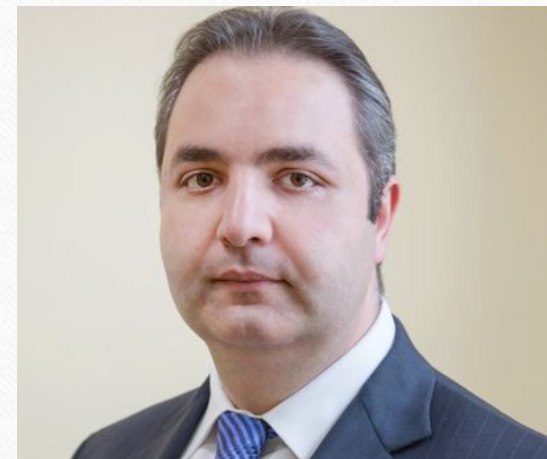
КАЛАМАНОВ ГЕОРГИЙ ВЛАДИМИРОВИЧ Заместитель Министра

Образование 1998 г. – Государственный университет управления (г. Москва) 2001 г. – аспирантура Государственного университета управления, кандидат психологических наук