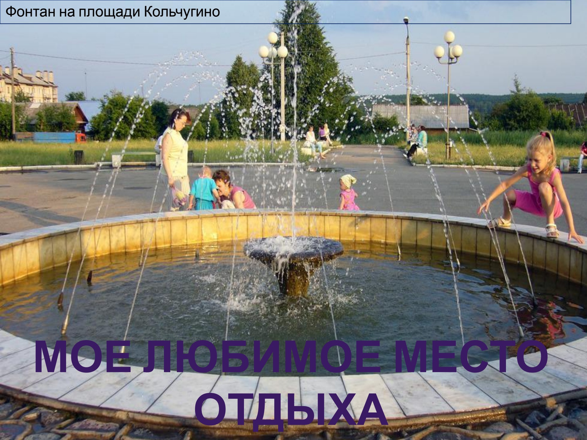
Фонтан на площади Кольчугино