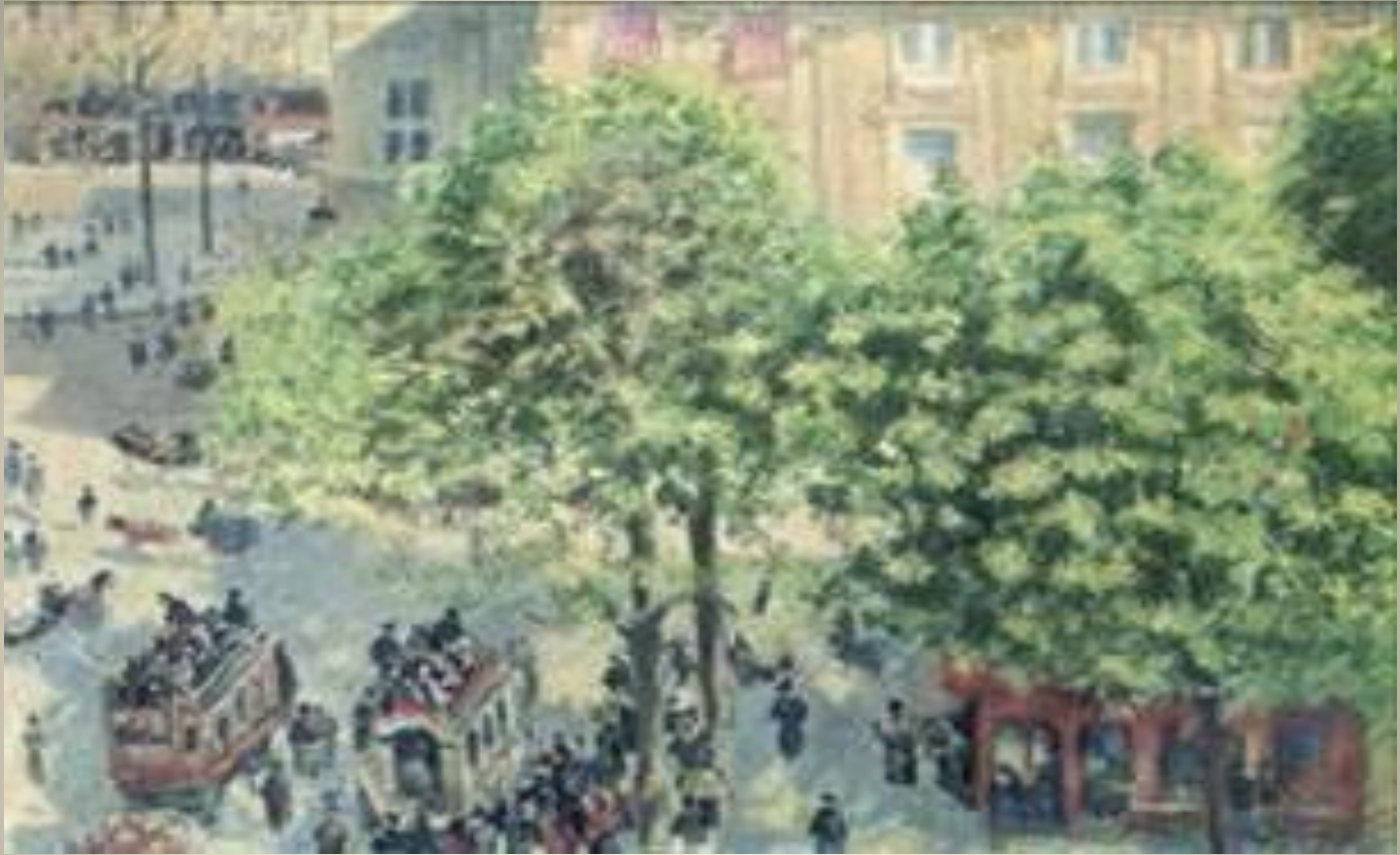
Place du théâtre français Camille Pissarro