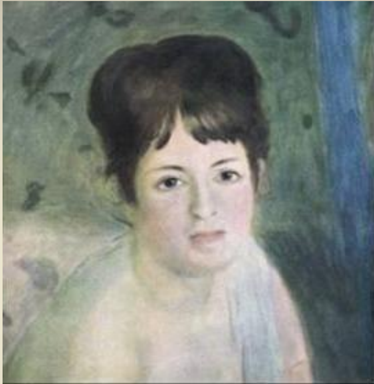
Tête de femme Pierre-Auguste Renoir