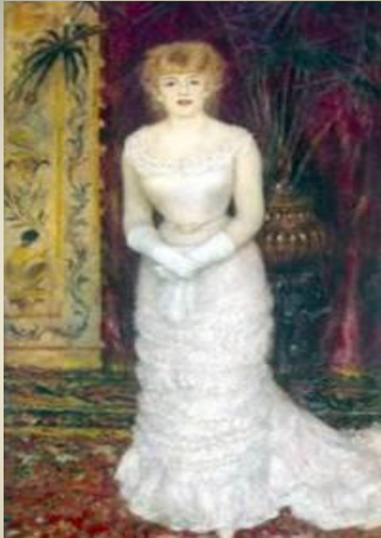
Portrait de l'actrice Jeanne Samary Pierre-Auguste Renoir