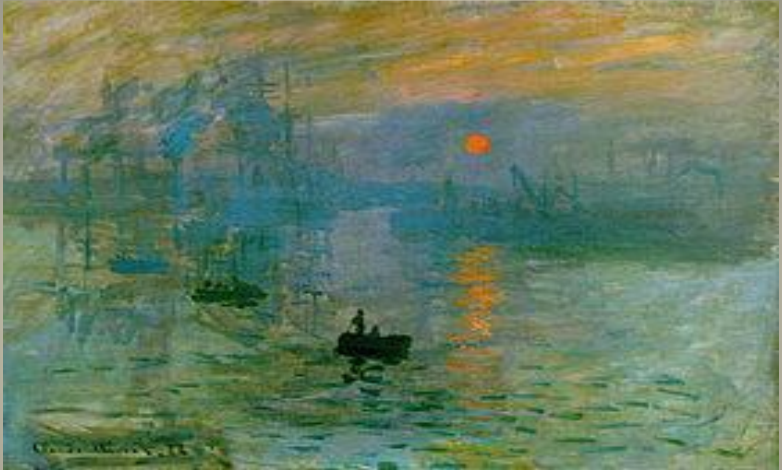
Impression, soleil levant Claude Monet