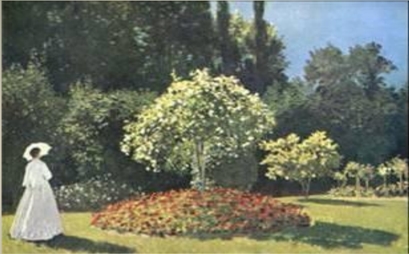
Dame au jardin Claude Monet