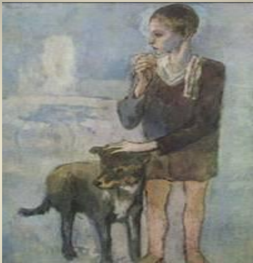
Garçon avec un chien Pablo Picasso