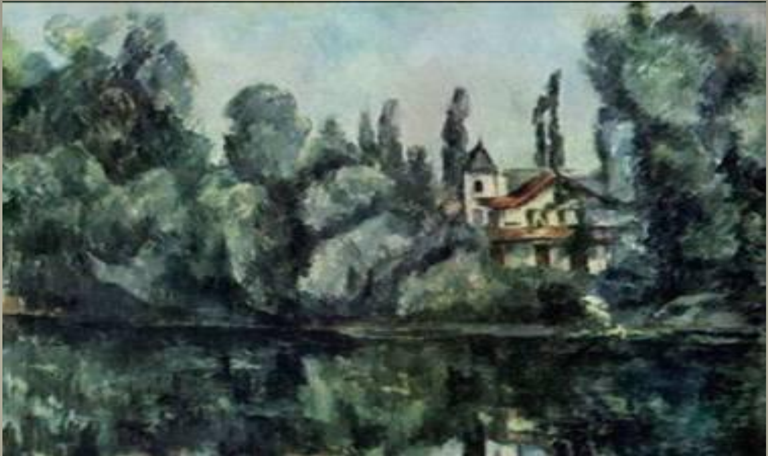
Côte de la Marne Paul Cézanne