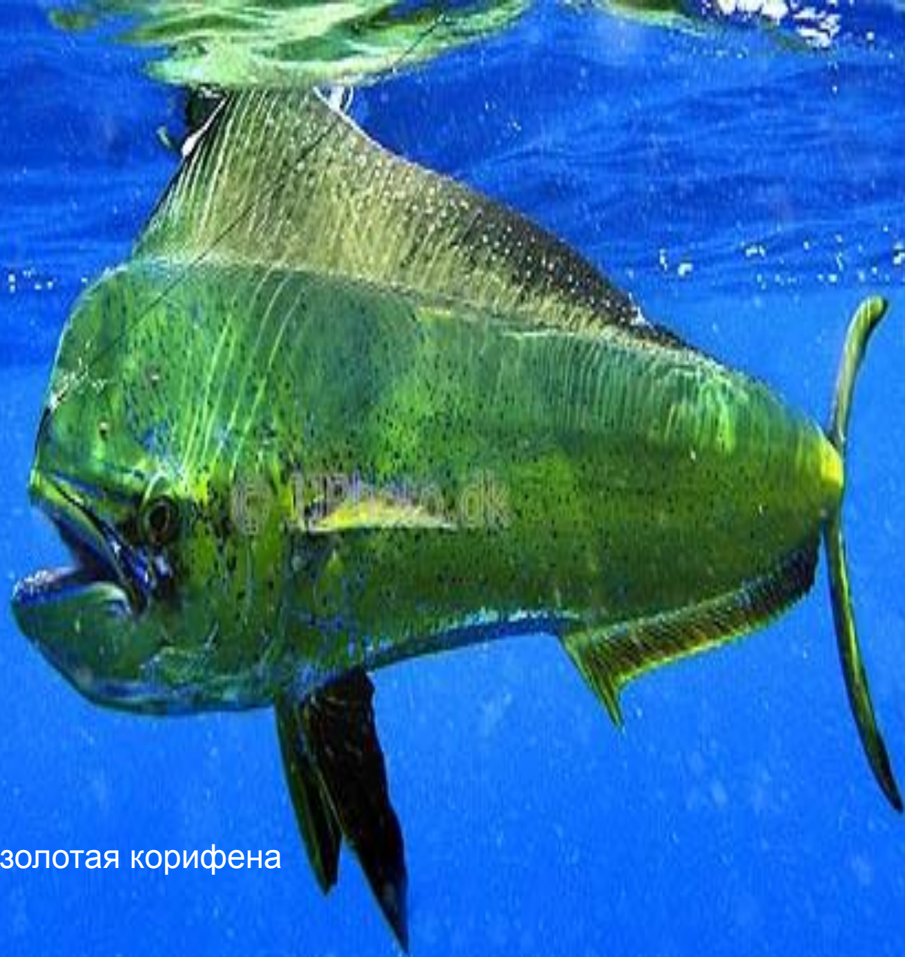
Зелёно – золотая корифена