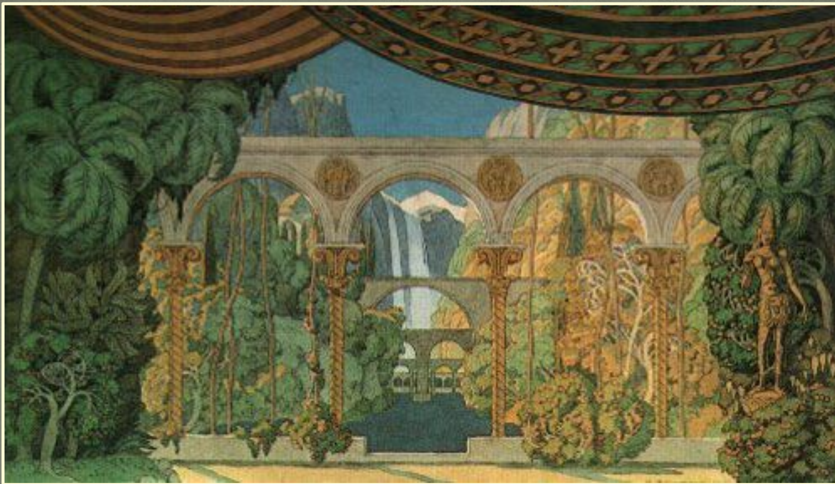
Эскиз декораций к опере Михаила Глинки «Руслан и Людмила»