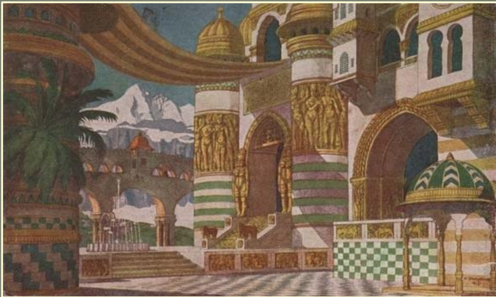
Эскиз декораций к опере Михаила Глинки «Руслан и Людмила»