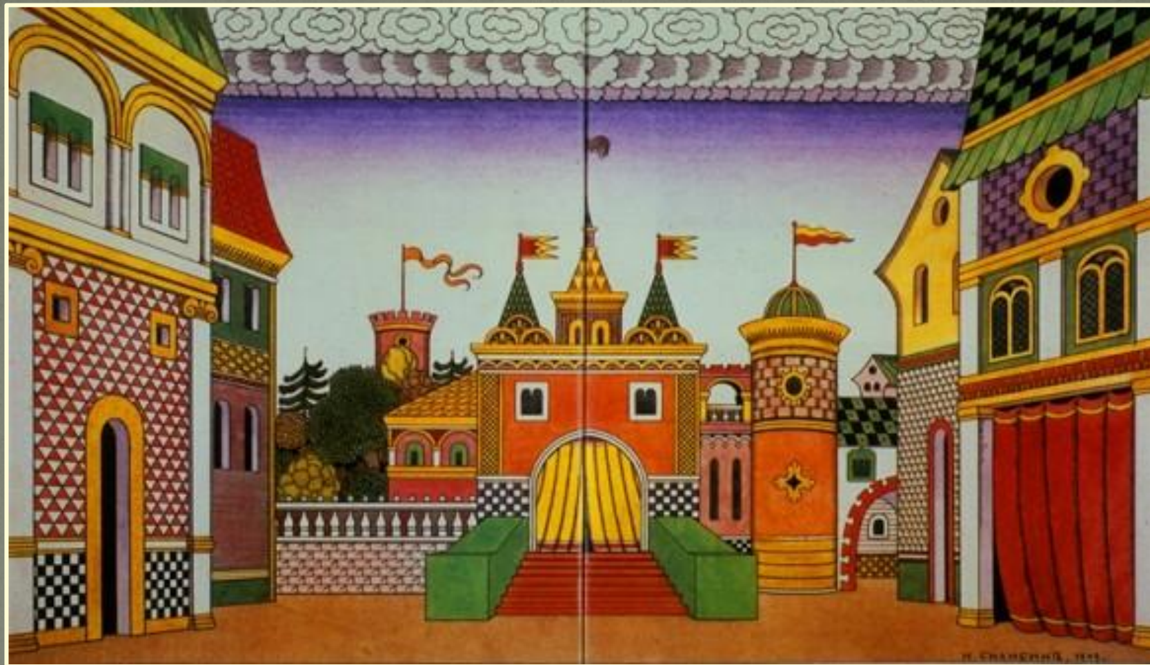
Эскиз к опере «Золотой петушок» Николая Римского-Корсакова