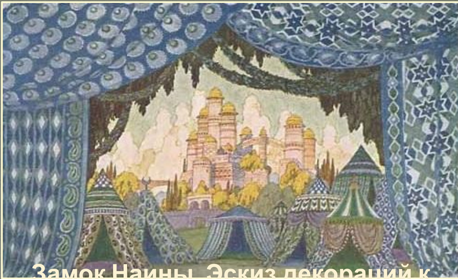
Замок Наины. Эскиз декораций к опере Михаила Глинки «Руслан и Людмила»