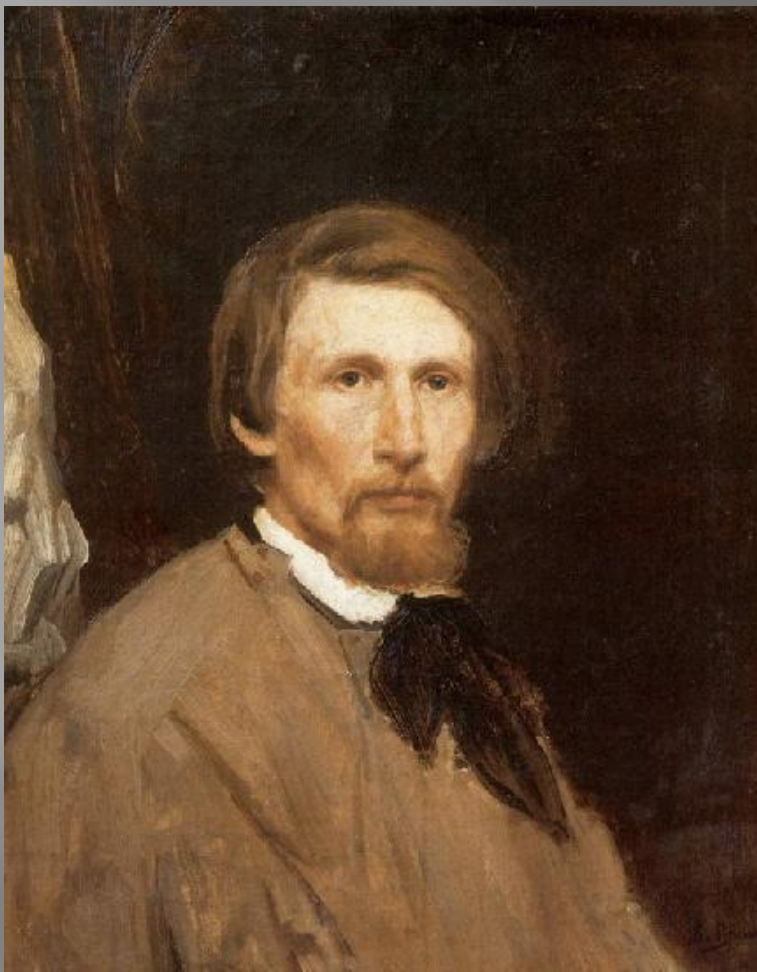
Виктор Михайлович Васнецов (1848 - 1926)

Васнецов Виктор Михайлович (1848 – 1926) – выдающийся русский художник, мастер живописи на исторические и фольклорные сюжеты.