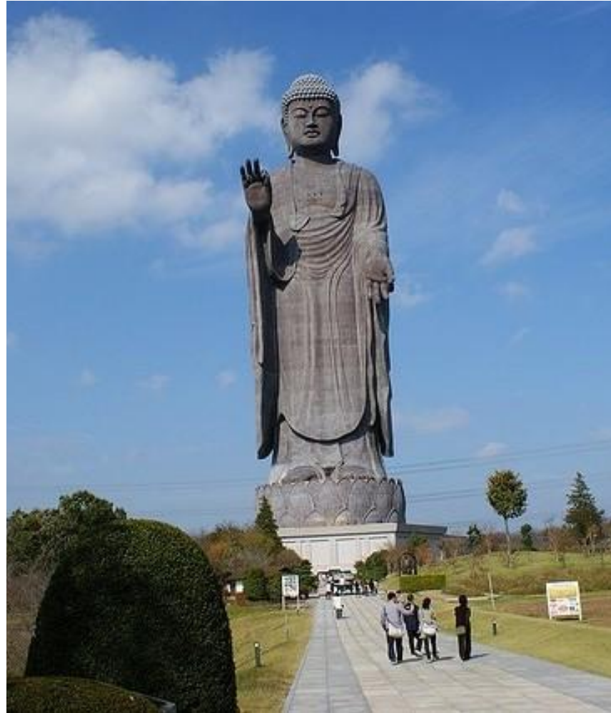
Дайбуцу Усику. Япония. 120 метров.