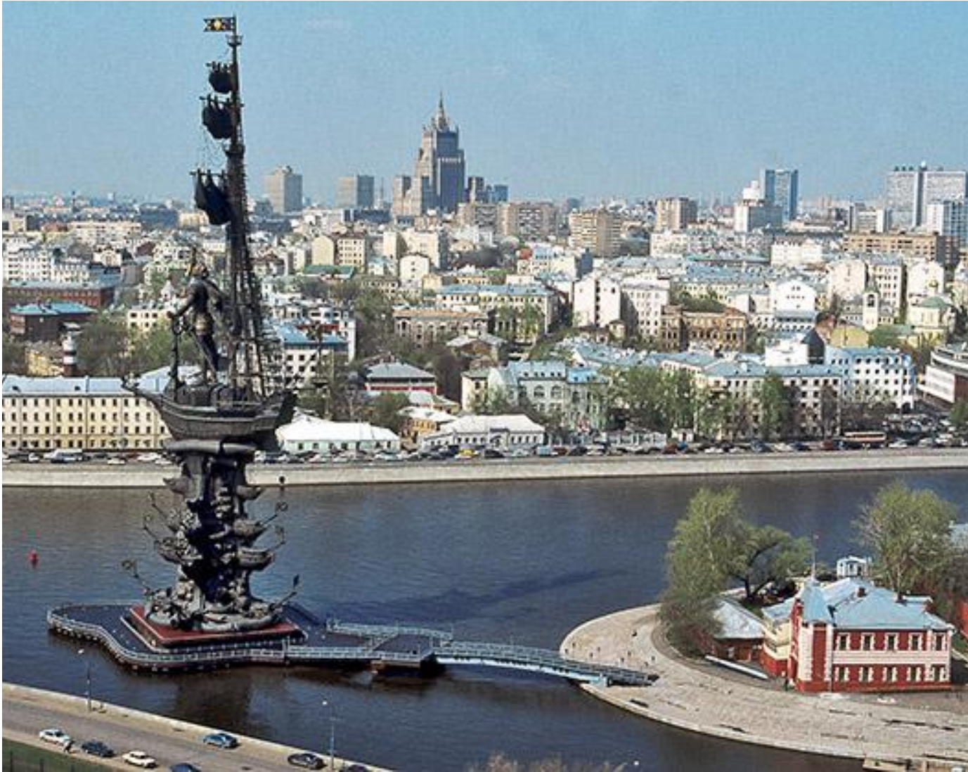
Па́мятник Петру́ I. Москва. 98 метров.