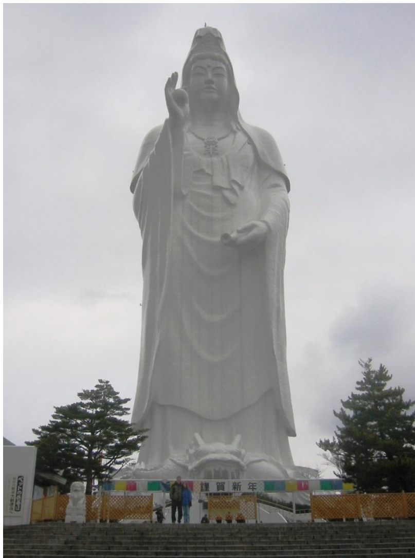
Статуя богини Каннон . Япония. 100 метров.