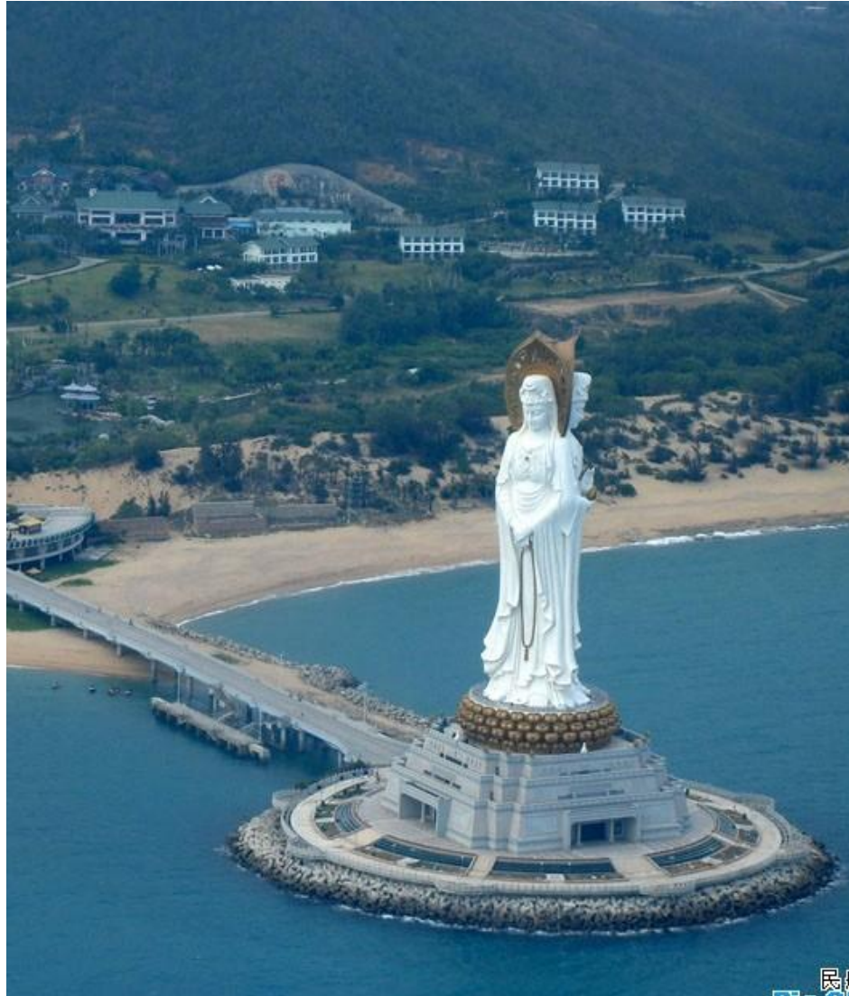
Статуя богини Гуаньинь . Китай. 108 метров