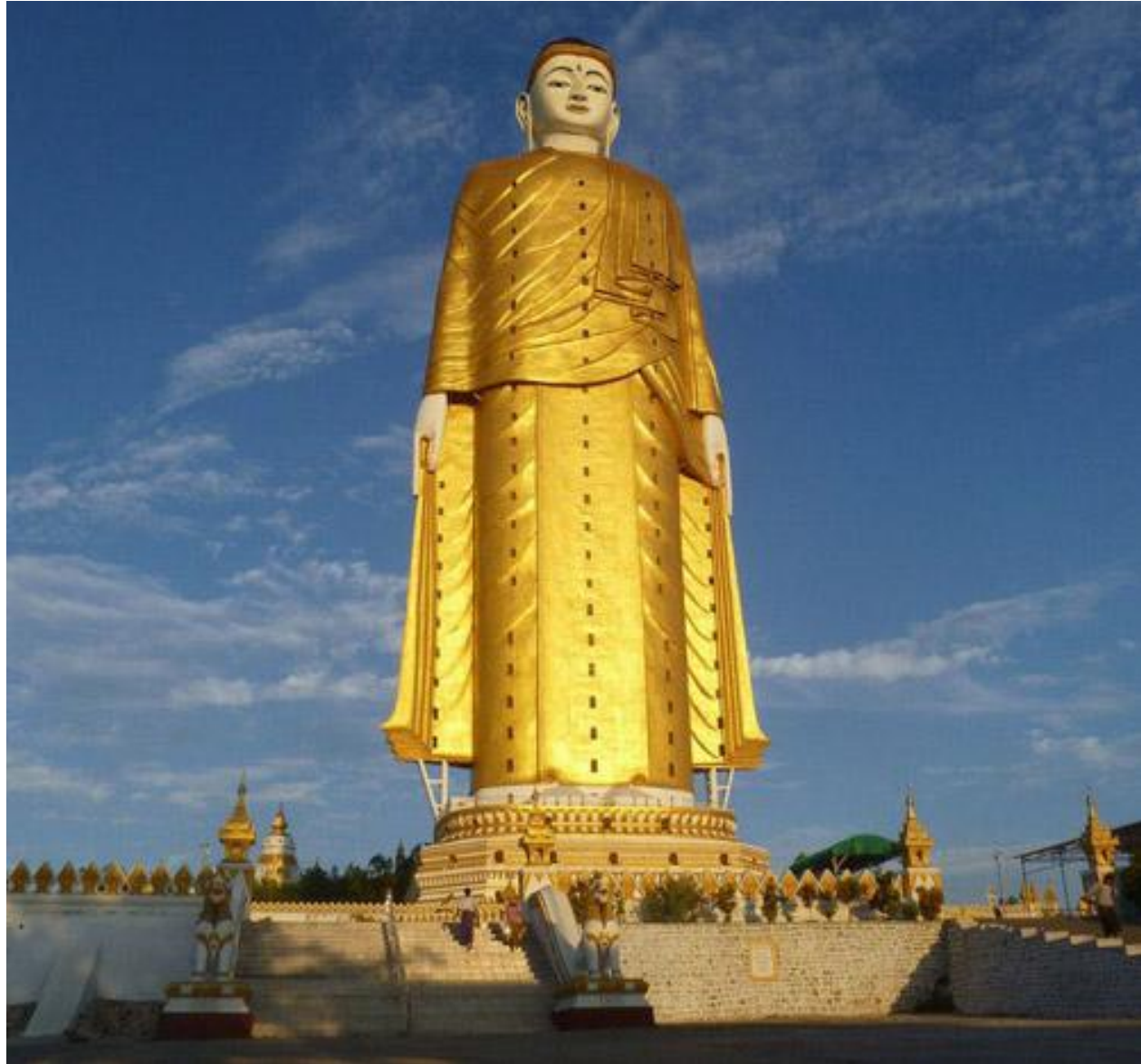
Будды Шакьямуни. Мьянма. 129 метров