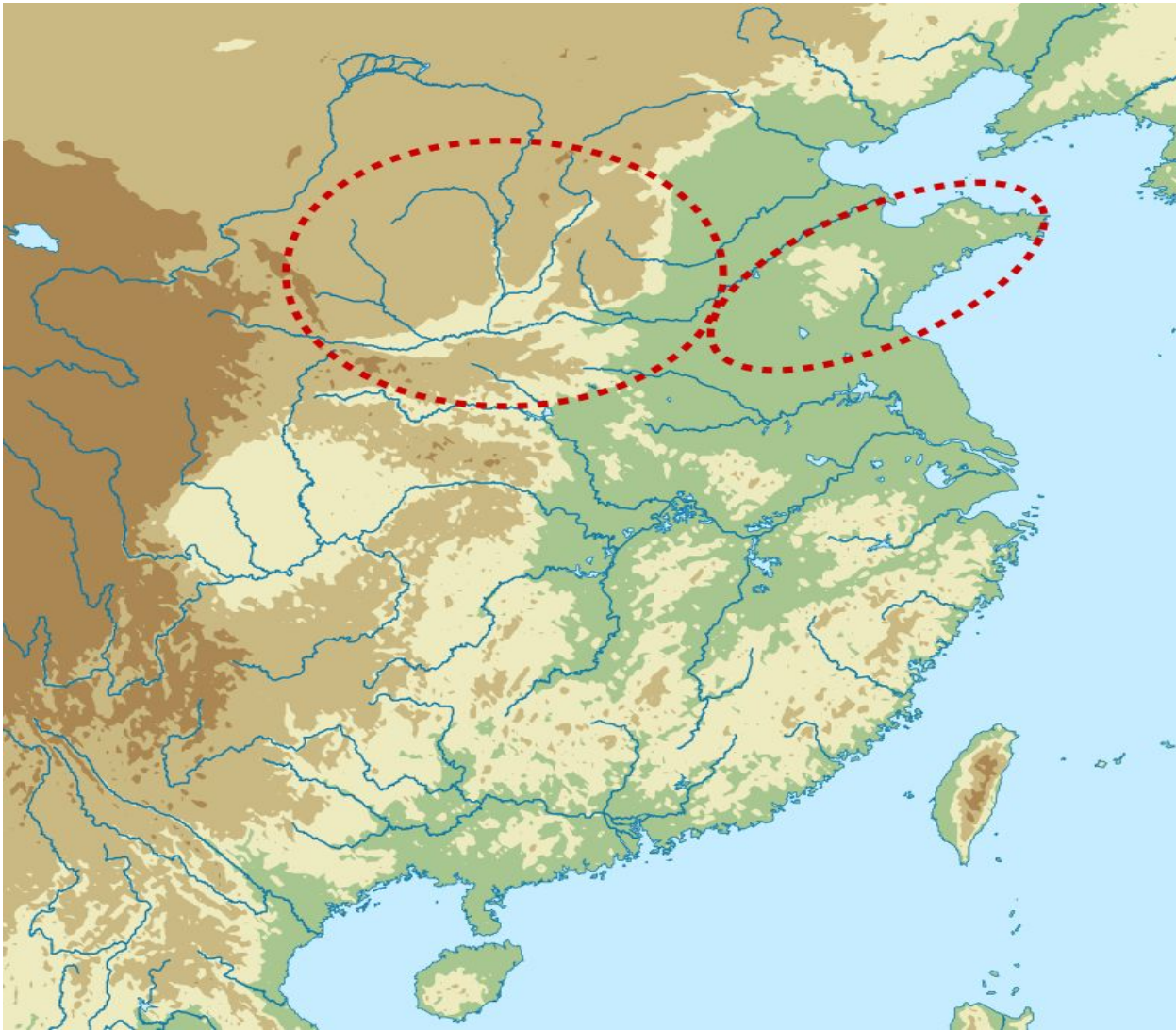
Ареал распространения культуры Луншань