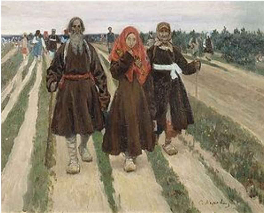
Сергей Коровин. К Троице. 1902 г.