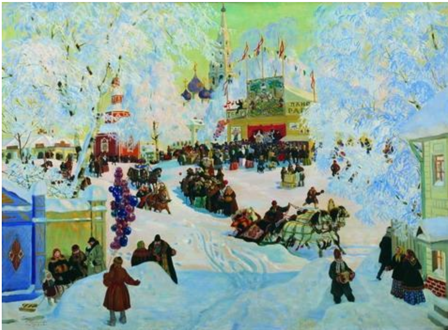
«Масленица. Б Кустодиев.