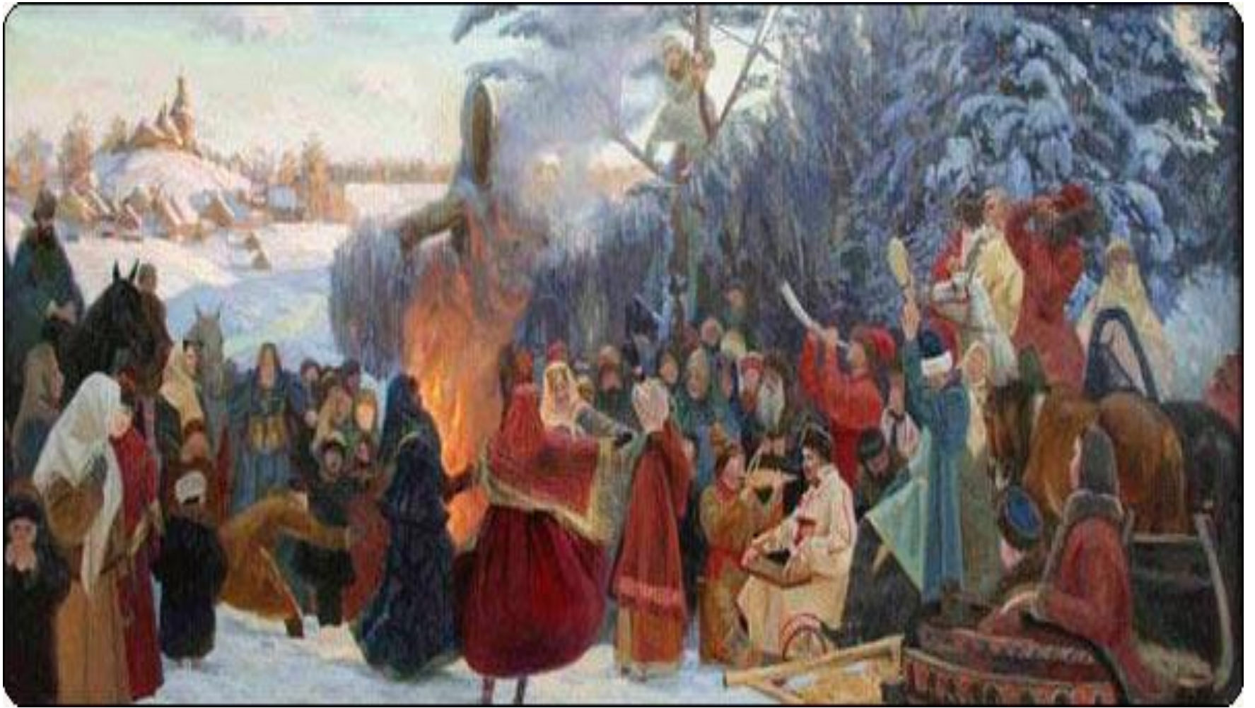
Сжигание Масленицы (Прощание).