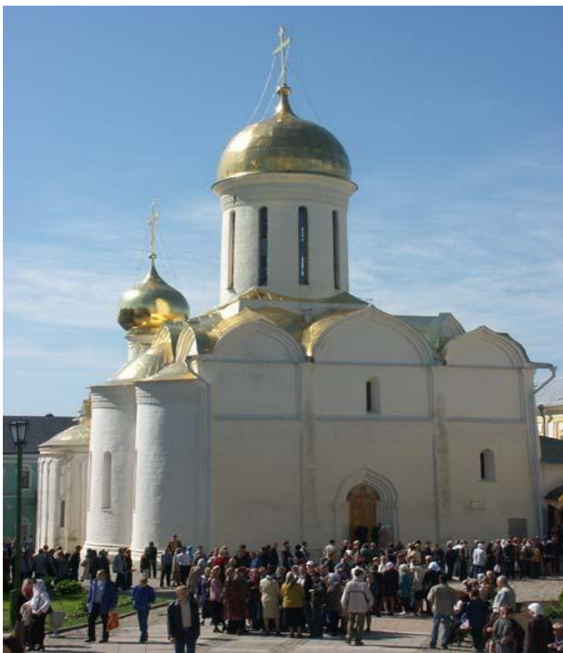
Троицкий собор. Москва.

Белокаменный Троицкий собор является одним из важнейших памятников раннемосковского зодчества. Он был воздвигнут в 1422 г. преподобным Никоном.