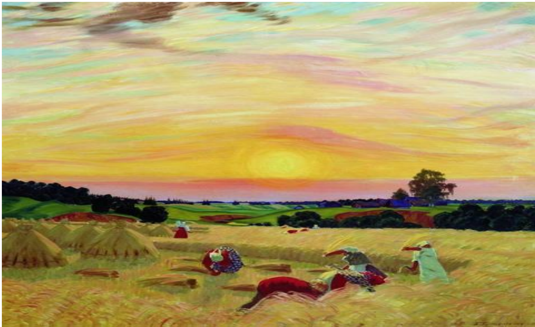
Б. Кустодиев. Жатва.