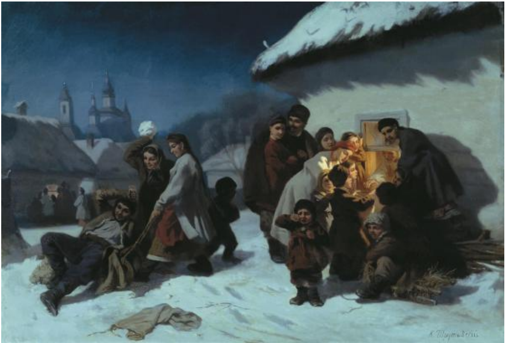
К.А.Трутовский. «Колядки в Малороссии».