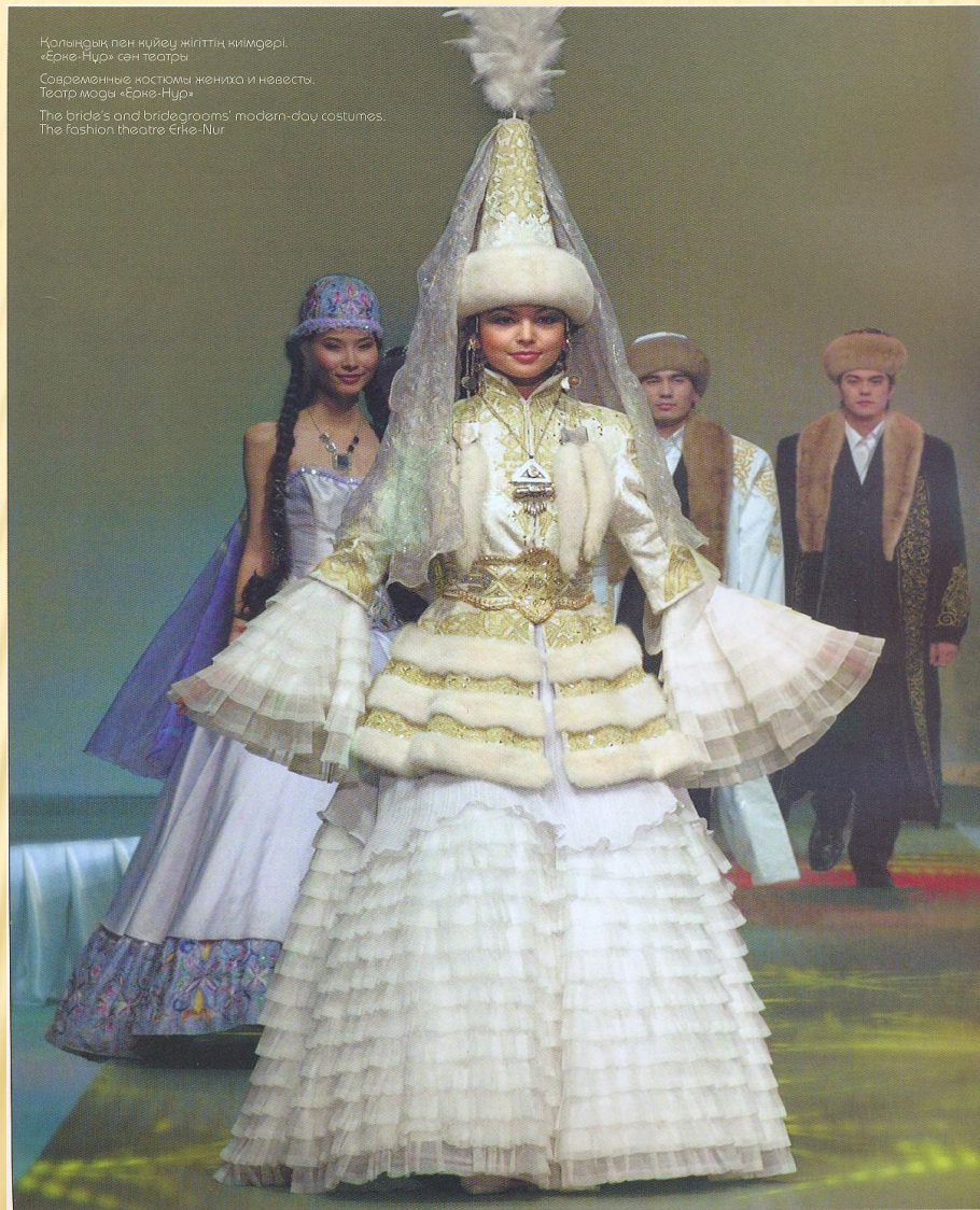
Қалыңдық пен күйеу жігіттің киімдері. «Ерке-Нур» сән тастры Современные костюмы жениха и невесты. Театр моды «Ерке-Нур» The bride's and bridegrooms' modern-day costumes. The fashion theatre Eрке-Nur