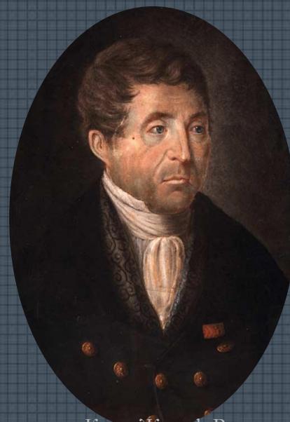
Клод Жозеф Руже

Раздайся, крик мести народной! Вперед! Вперед!