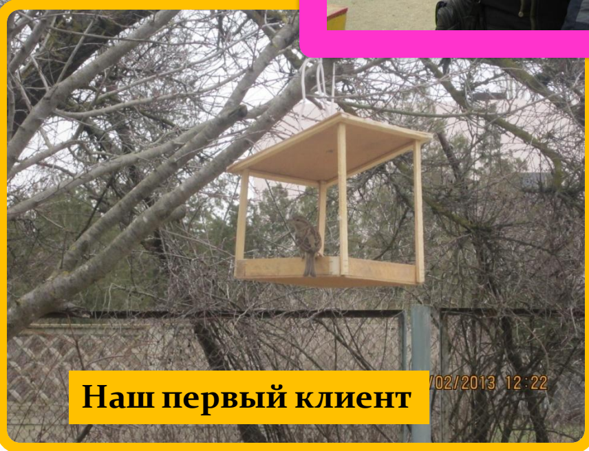
Наш первый клиент