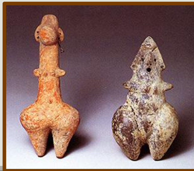
Терракотовые статуэтки Богини матери Иран нач. 1 тыс. до н. э.