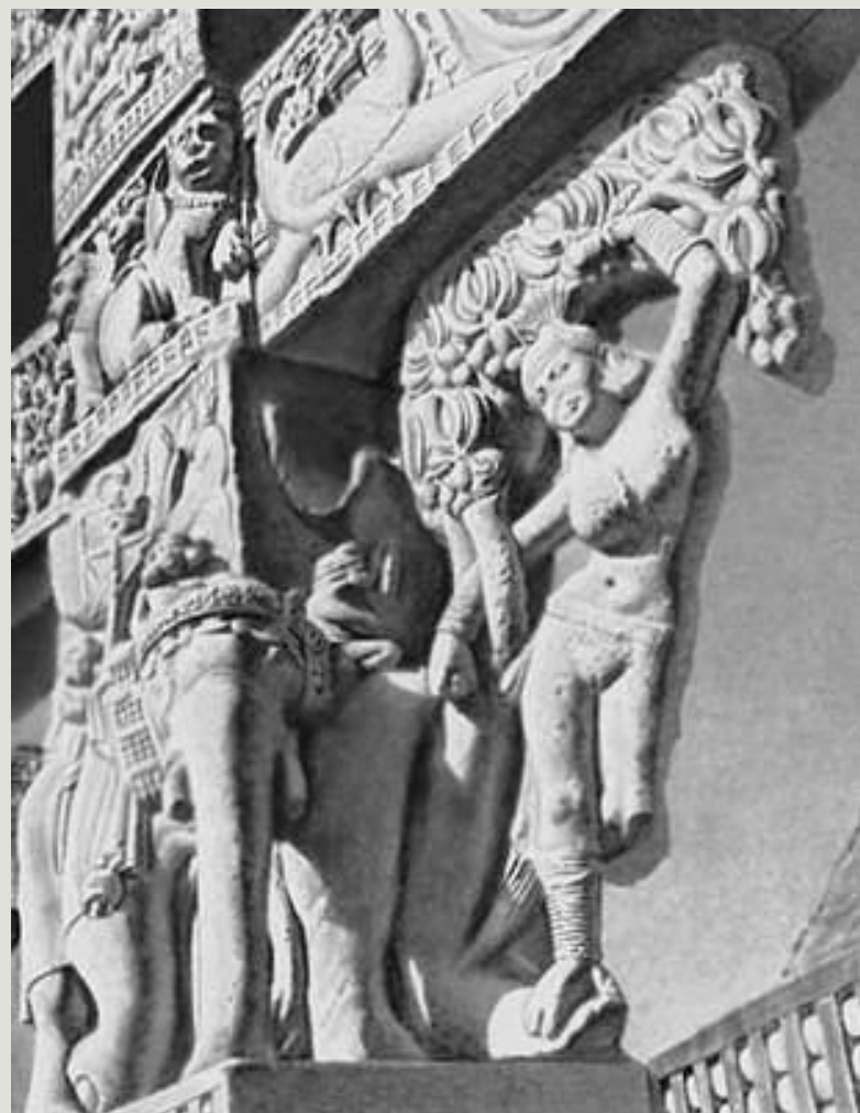
Восточные ворота Большой ступы