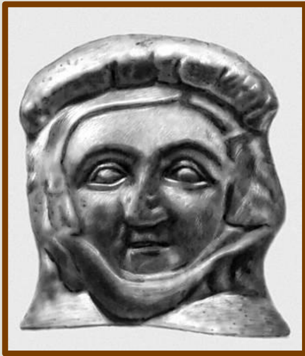
Кей Кобад шах. Головка терракотовой статуэтки Около 1 в. до н. э. 1 в. н. э.