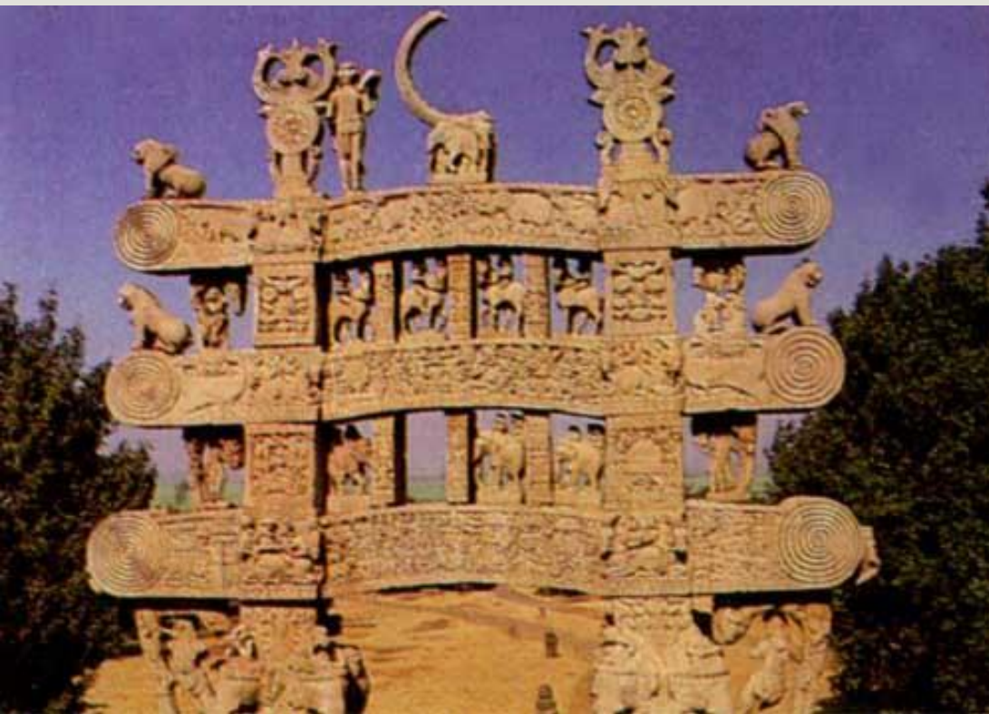
Северные ворота Большой ступы