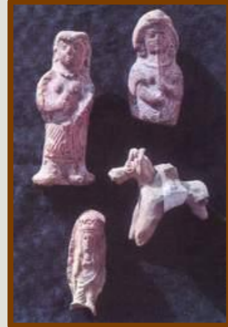
Терракотовые статуэтки I-VI вв н. э. Самарканд и его окрестности

Распространение в Индии буддизма «великой колесницы» способствовало появлению обширного пантеона святых бодхисатв. Массовые находки терракотовых статуэток говорят о широком спросе на произведения искусства, связанного с буддизмом.