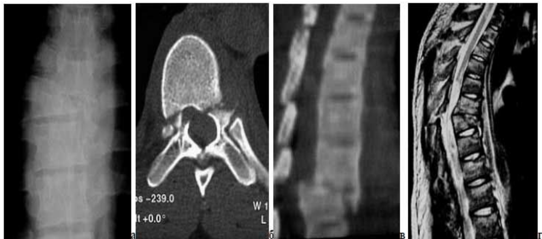
Рисунок 3. а-б - неосложненный переломо-вывих Th7, Frankel – E; а - рентгенограмма, передне-задняя проекция: боковое смещение на 2/3 тела позвонка, сминание нижележащего позвонка более 2/3 его высоты; б- КТ, поперечный срез: перелом ножек позвонка у основания; ножки и дужки в связи с задними элементами, не смещены; в-г - осложненный переломо-вывих Th6, Frankel - А (без регресса); КТ и МРТ, боковая проекция - срезающий механизм смещения, дужка Th6 смещена вместе с телом позвонка, штыкообразная деформация позвоночного канала и его сужение на 2/3, компрессия спинного мозга, гематомиелия