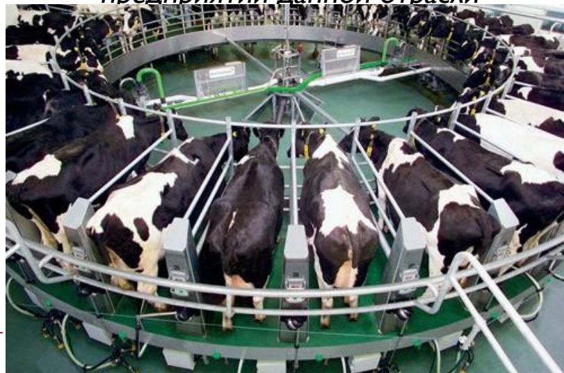
Росагролизинг внедряет новые технологии

Дополнительная прибыль исчезает, как только технические усовершенствования становятся достоянием большинства предприятий данной отрасли