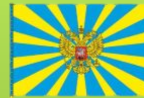
На официальных знамёнах и флагах