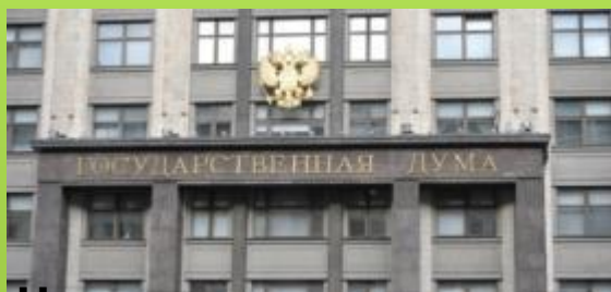
На зданиях госучреждений