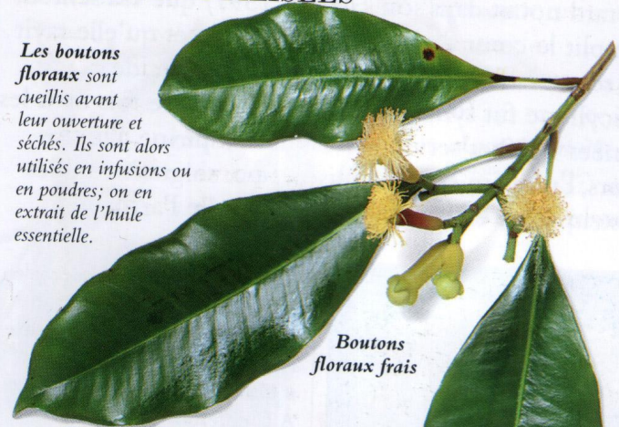
Boutons floraux frais

Les boutons floraux sont cueillis avant leur ouverture et séchés. Ils sont alors utilisés en infusions ou en poudres; on en extrait de l'huile essentielle.