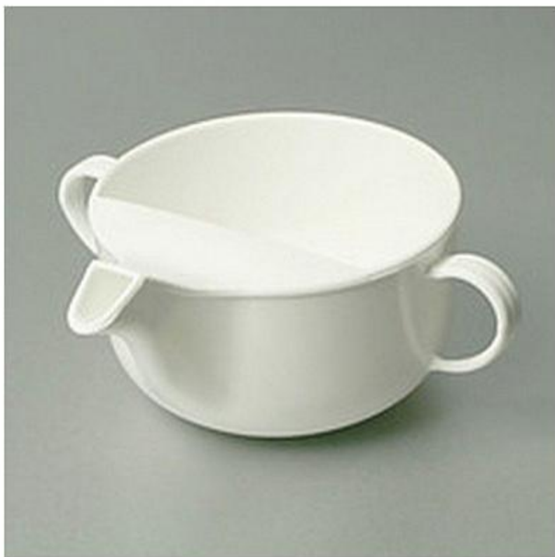
Поильник полимерный для лежачих больных 200 мл