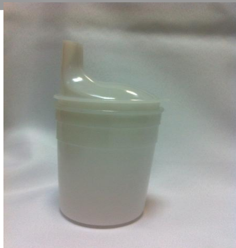
Стакан полимерный 200 мл