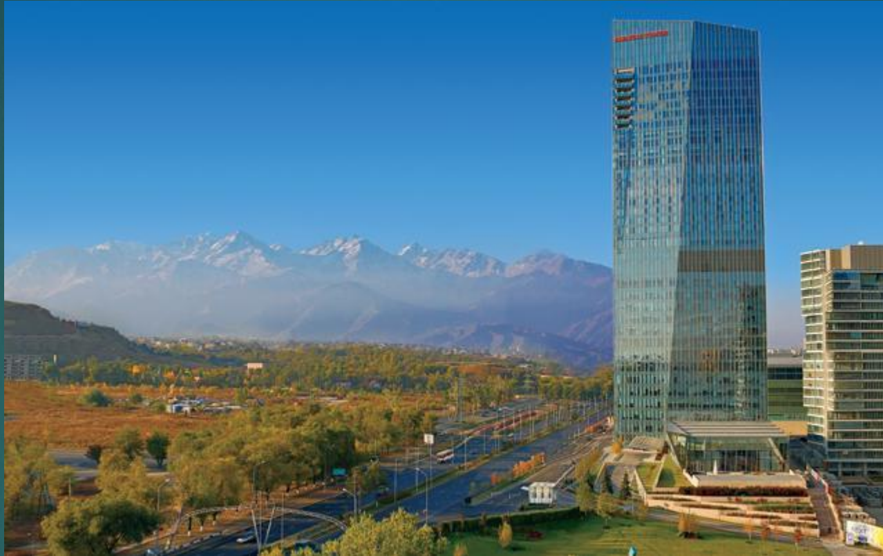
The Ritz-Carlton, Алматы