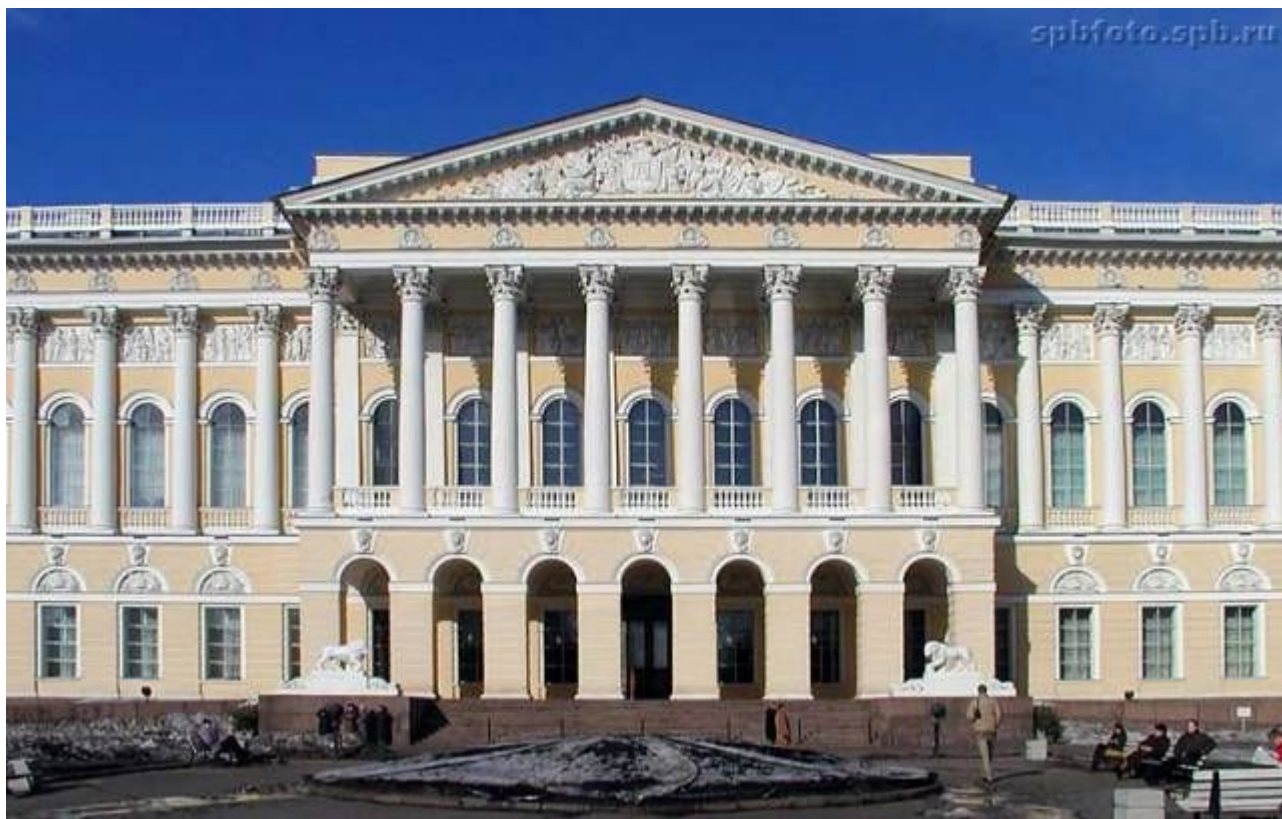
«Русский музей искусств» Карл Иванович Росси