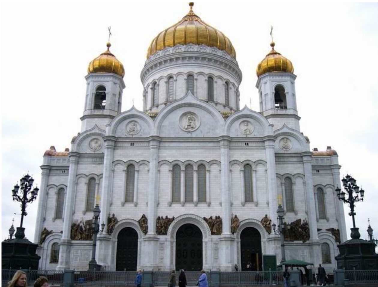
Константин Андреевич Тон. Храм Христа Спасителя. Русско-византийский стиль