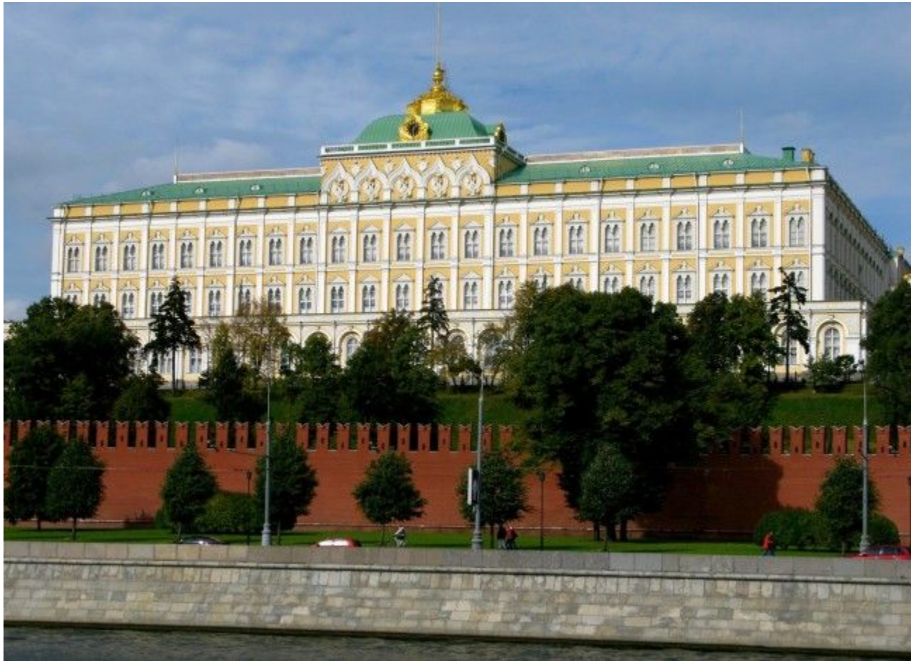
«большой Кремлевский дворец. Архитектор К.А.