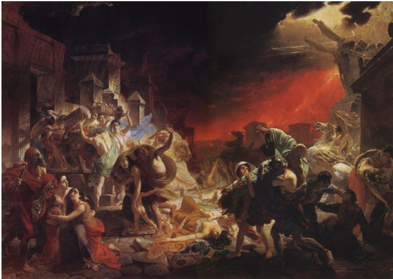
Последний день Помпеи