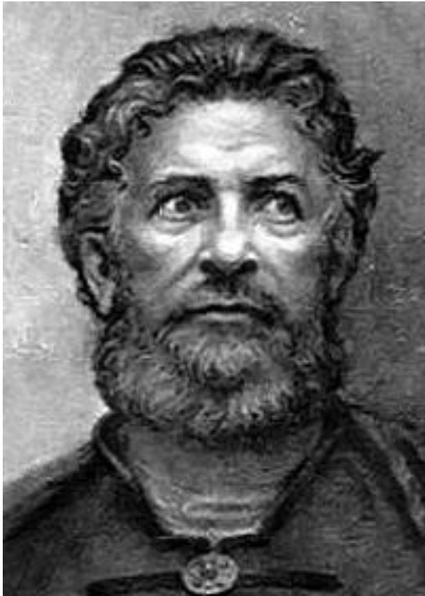
Афанасий Никитин, тверской купец

«Русскую землю Бог да сохранит! Боже, храни её! Господь, храни её! На этом свете нет страны, подобной ей! Но почему князья земли Русской не живут друг с другом как братья! Пусть устроится Русская земля, а то мало в ней справедливости. Боже, Боже, Боже, Боже...»