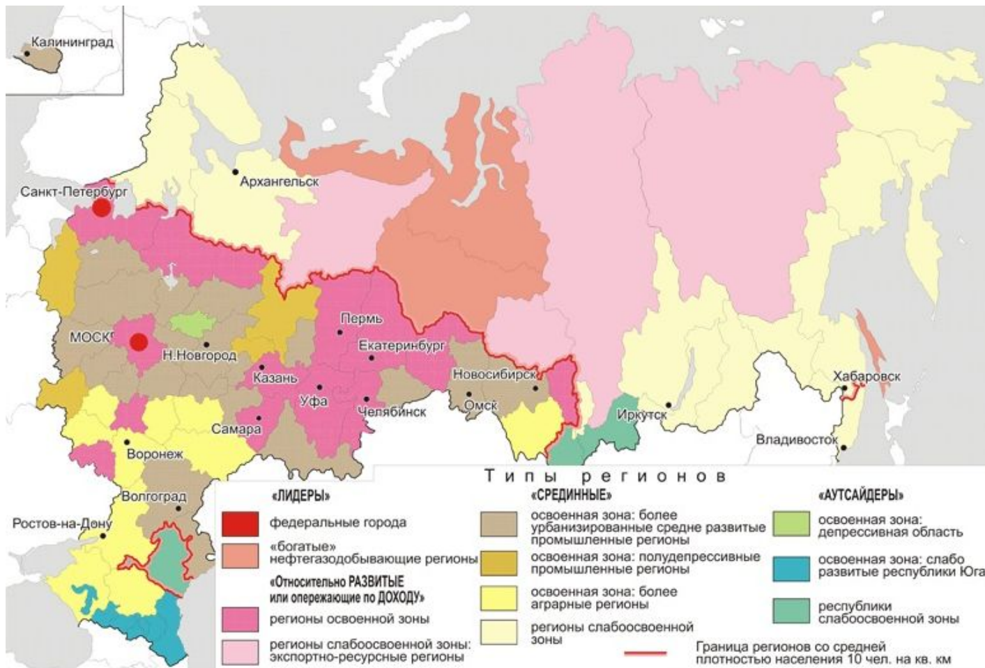
Социально-экономические типы регионов, 2010 г.