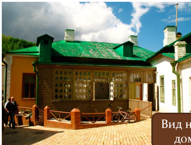
Вид на террасу турбинского дома с заднего двора

Спуск пролегает между двух гор, и дом стоит на склоне одной из них. Такое расположение и послужило причиной описанной в романе особенности постройки: на улицу квартира Турбиных оказывается во втором этаже, а во внутренний двор с противоположной стороны – в первом. В этом дворе под самой стеной дома зияет провал, заглянув в который можно увидеть подвальный дворик соседей с первого этажа. Туда, вниз, со двора ведет лестница, а над провалом вдоль стены флигеля перекинут деревянный мостик к веранде Булгаковых-Турбиных.