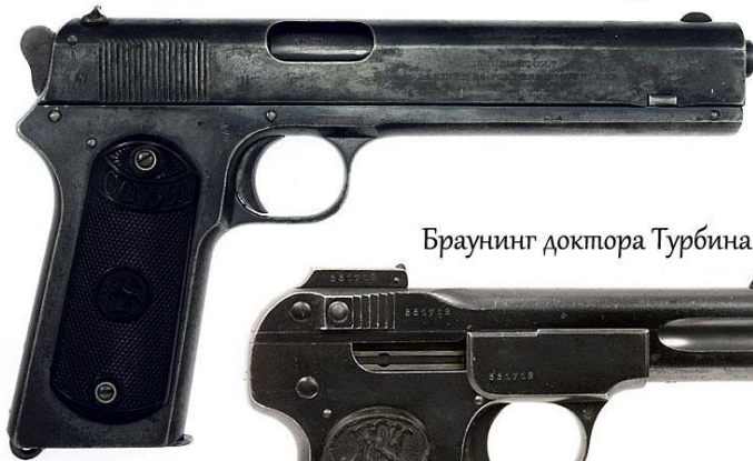
Браунинг доктора Турбина