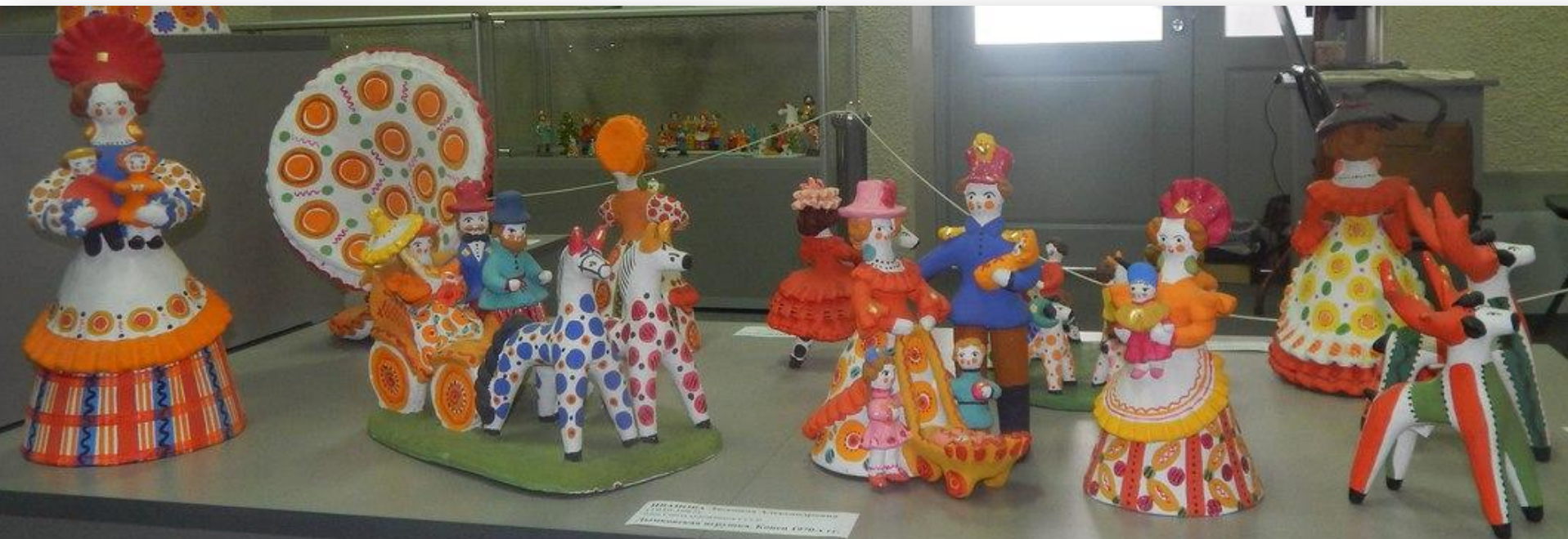
Игрушки из слободы Дымково. Конец XIX – нач. XX вв.