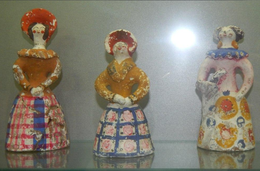
НЕИЗВЕСТНЫЕ МАСТЕРА из слободы Дымково Дымковская игрушка. Конец XIX – нач. XX вв.