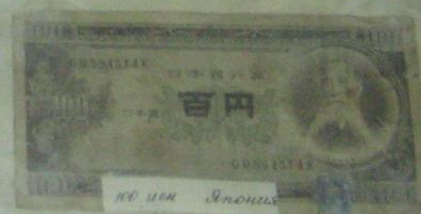
100 иен Япония