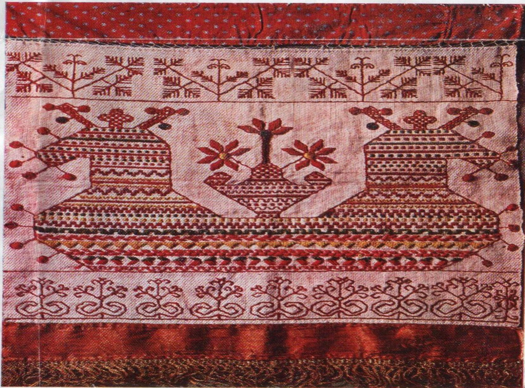
Северная вышивка. Фрагмент конца полотенца