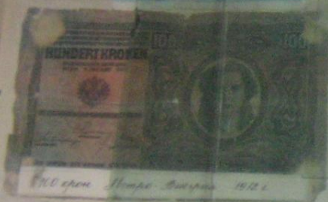
100 крон Норвегия 1912 г.