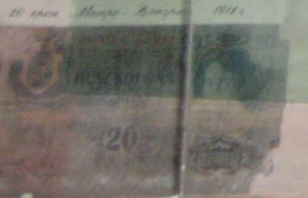
20 крон Норвегия 1912 г.