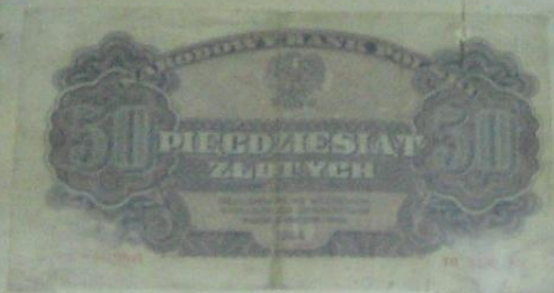
50 злотые Польша 1944 г.