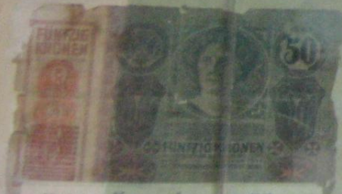
50 крон Норвегия 1912 г.