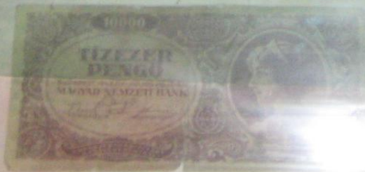
10000 форин Венгрия 1946 г.