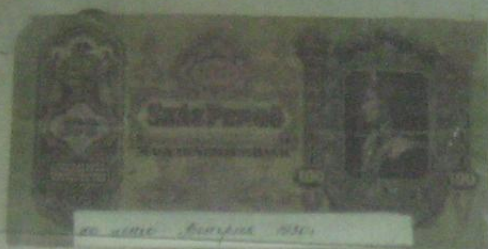
20 марка Германия 1936 г.