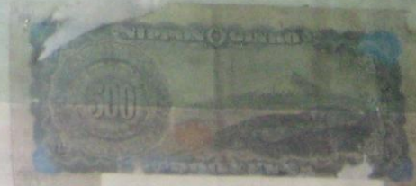
1 доллар - США 1963 г.