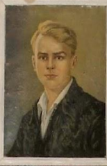
Вот такие ребята, добрые и смелые, Ленинские комсомольцы Ленинского Союза.