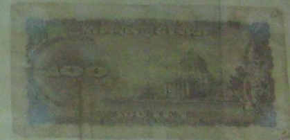
100 иен Япония