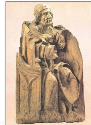
Скульптура «Святой Григорий». Конец XV — начало XVI в.