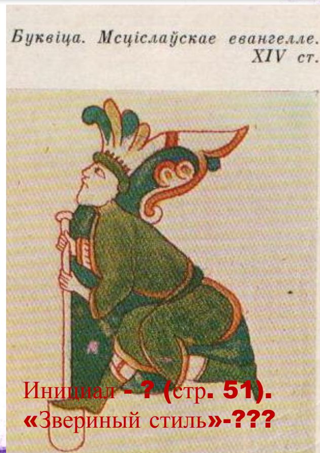
Инициал - ? (стр. 51). «Звериный стиль»-???