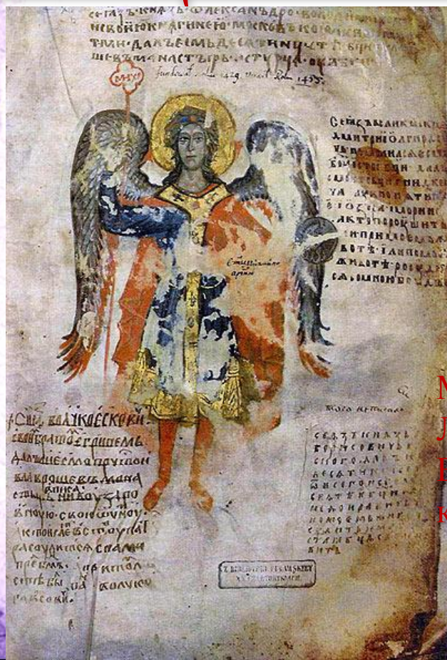
Миниатюра Лавришевского Евангелия (приближено к реальной жизни)