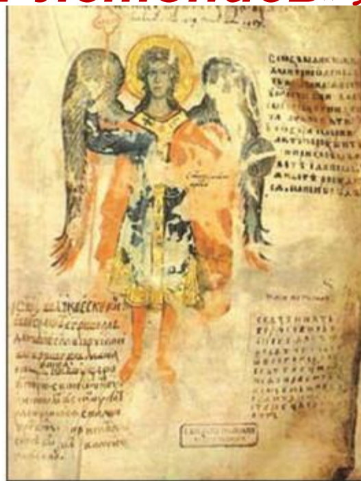
Миниатюра из Лавришевского евангелия