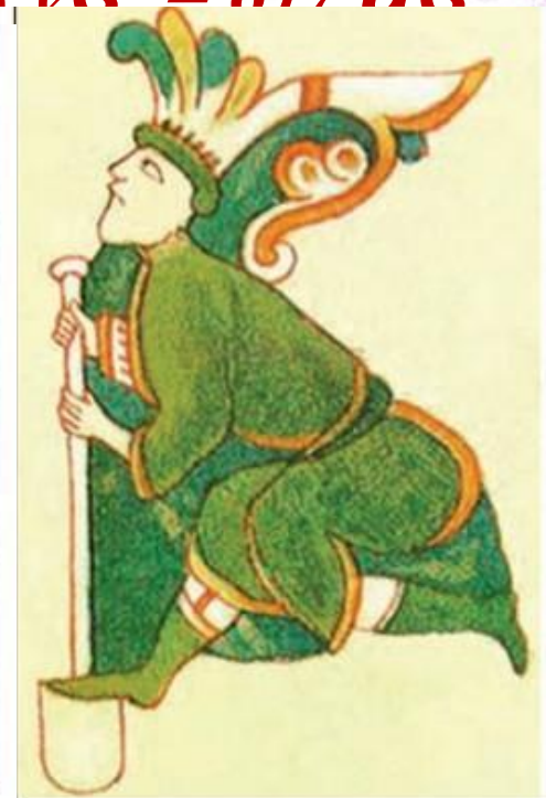
Инициал из Мстижского евангелия