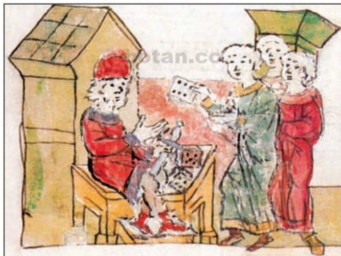
Игра в кости. Миниатюра из Радзивилловской летописи. XV в.