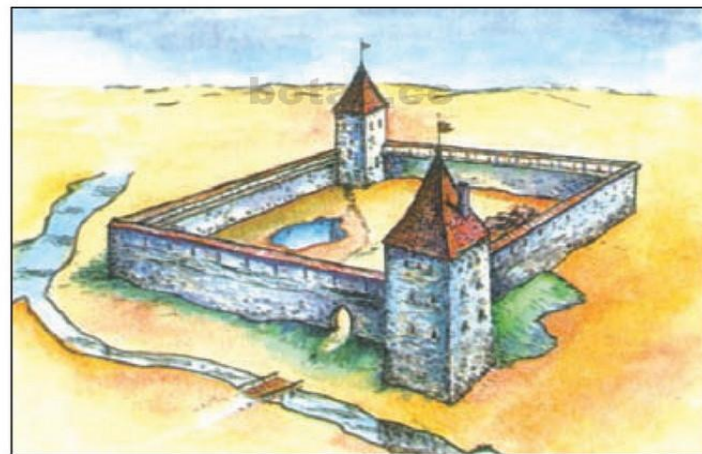
Кревский замок. Реконструкция