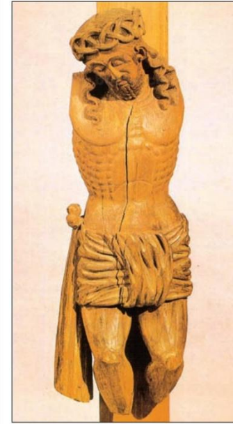
Распятие из деревни Голубичи