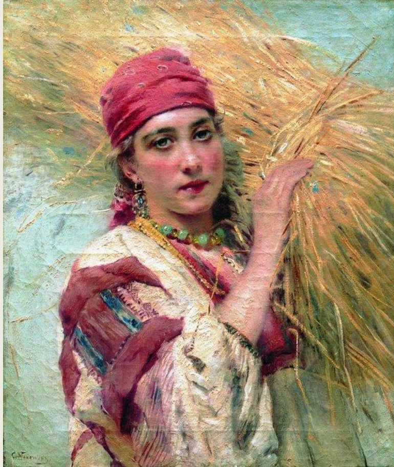
К.Е.МАКОВСКИЙ ПОРТРЕТ ДЕВУШКИ С СНОПОМ