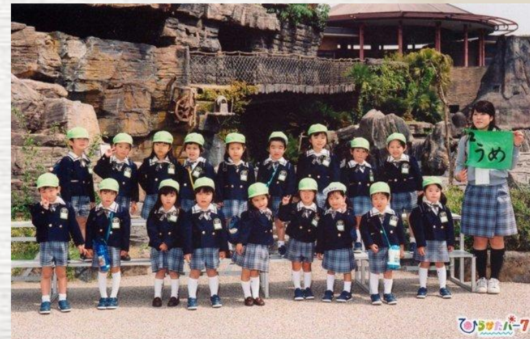
清香学園 うらら幼稚園 春の遠足 平成19年4月