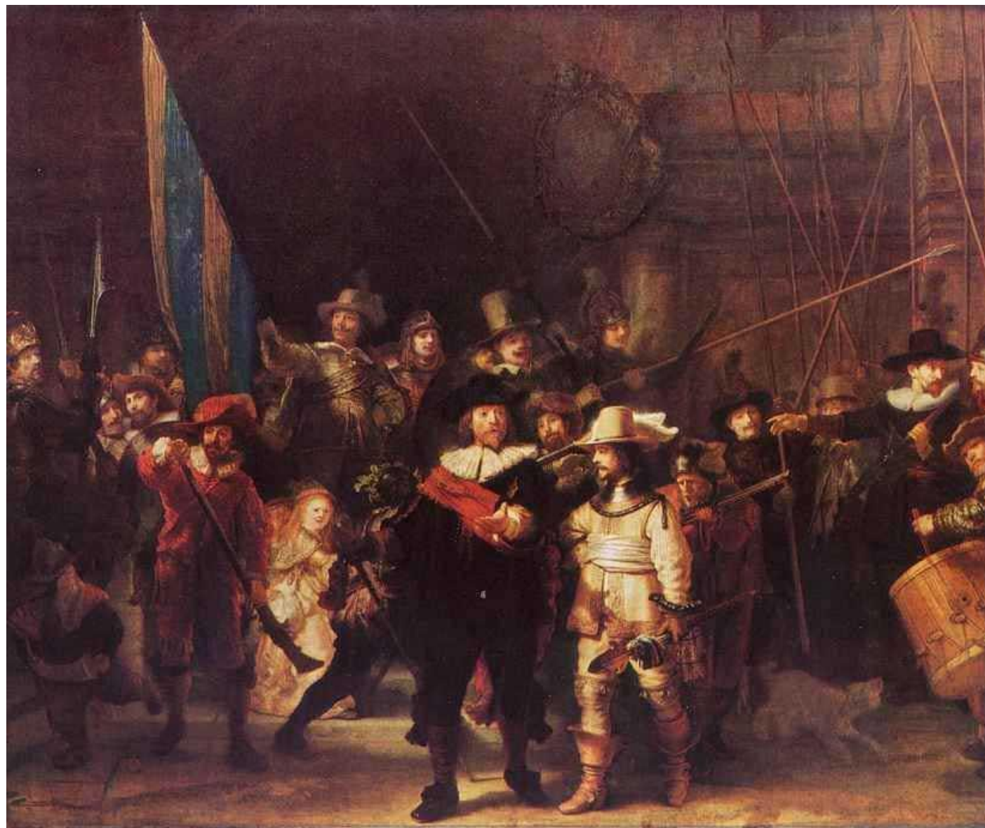
Рембранд Харменс Ван Рейн. Ночной дозор. 1642.