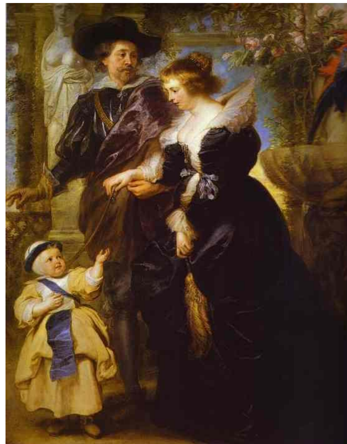
Питер Пауэль Рубенс.

Признанными шедеврами архитектуры Франции стали Лувр, Версальский дворец, Собор инвалидов и др.