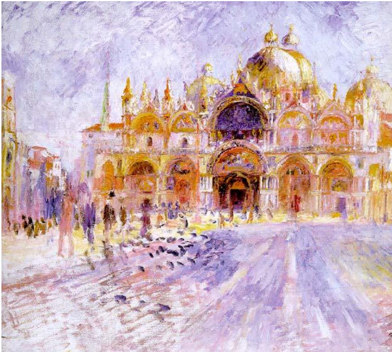
Пьяцца сан Марко. Ренуар. 1881.