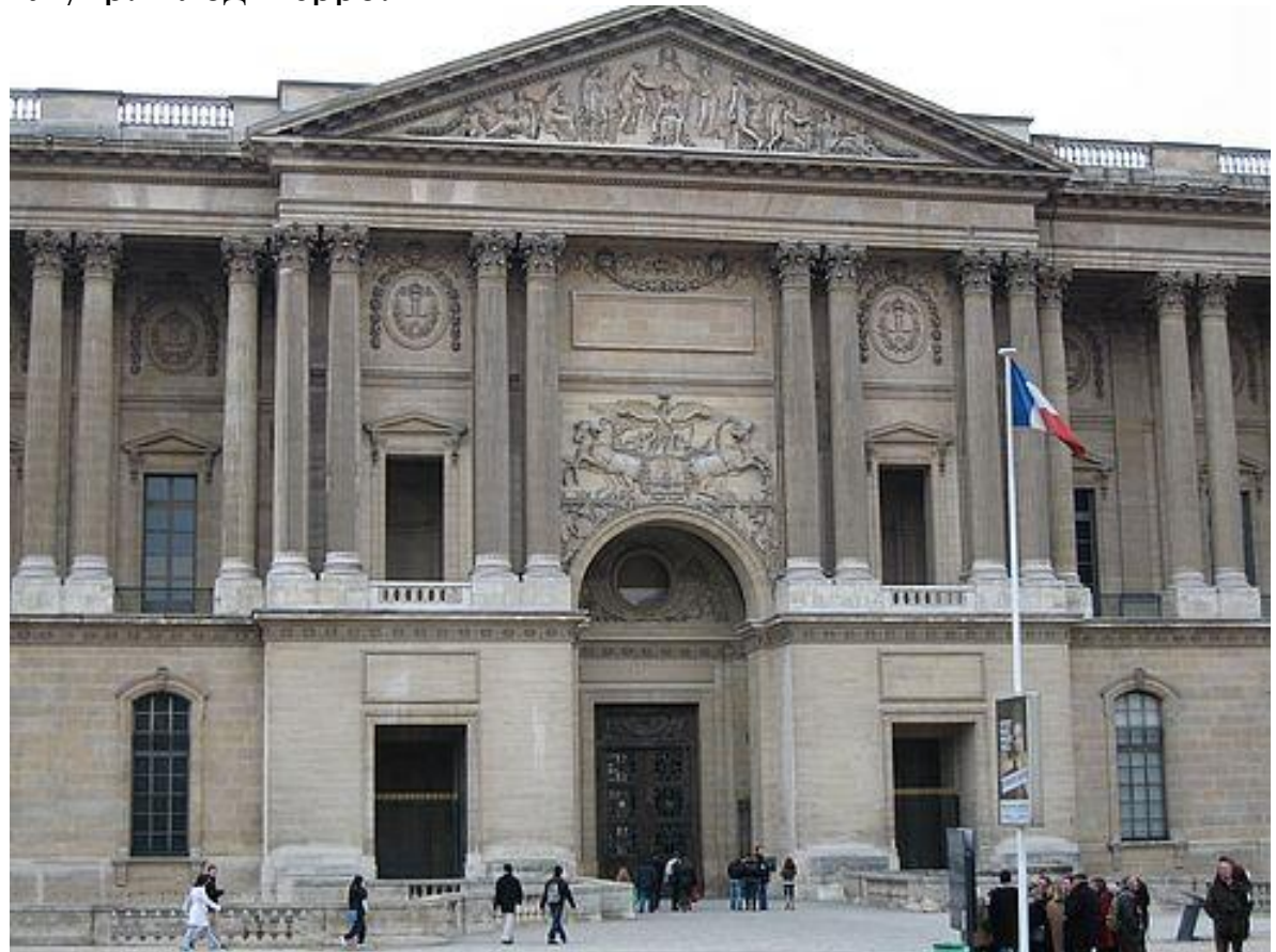
Лувр. Клод Перро.

Характеризуется стремлением к ясности, пропорциональности, уравновешенности и гармонии форм. В искусстве Беларуси классицизм был распространен в конце XVIII – XIX вв.