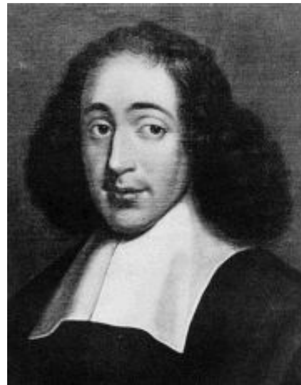
Бенедикт Спиноза (1632 – 1677)

Развил учение Гоббса о сильном государстве, считал, что высшей формой власти должна быть не монархия, а демократическое правление .