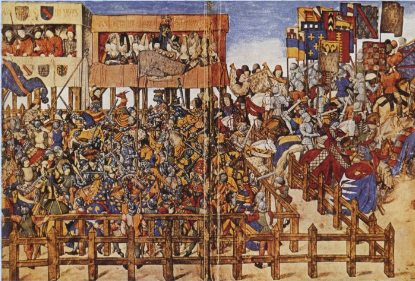
Група кінних рицарів готується до початку турніру. Мініатюра з книги Рене Анжуйського