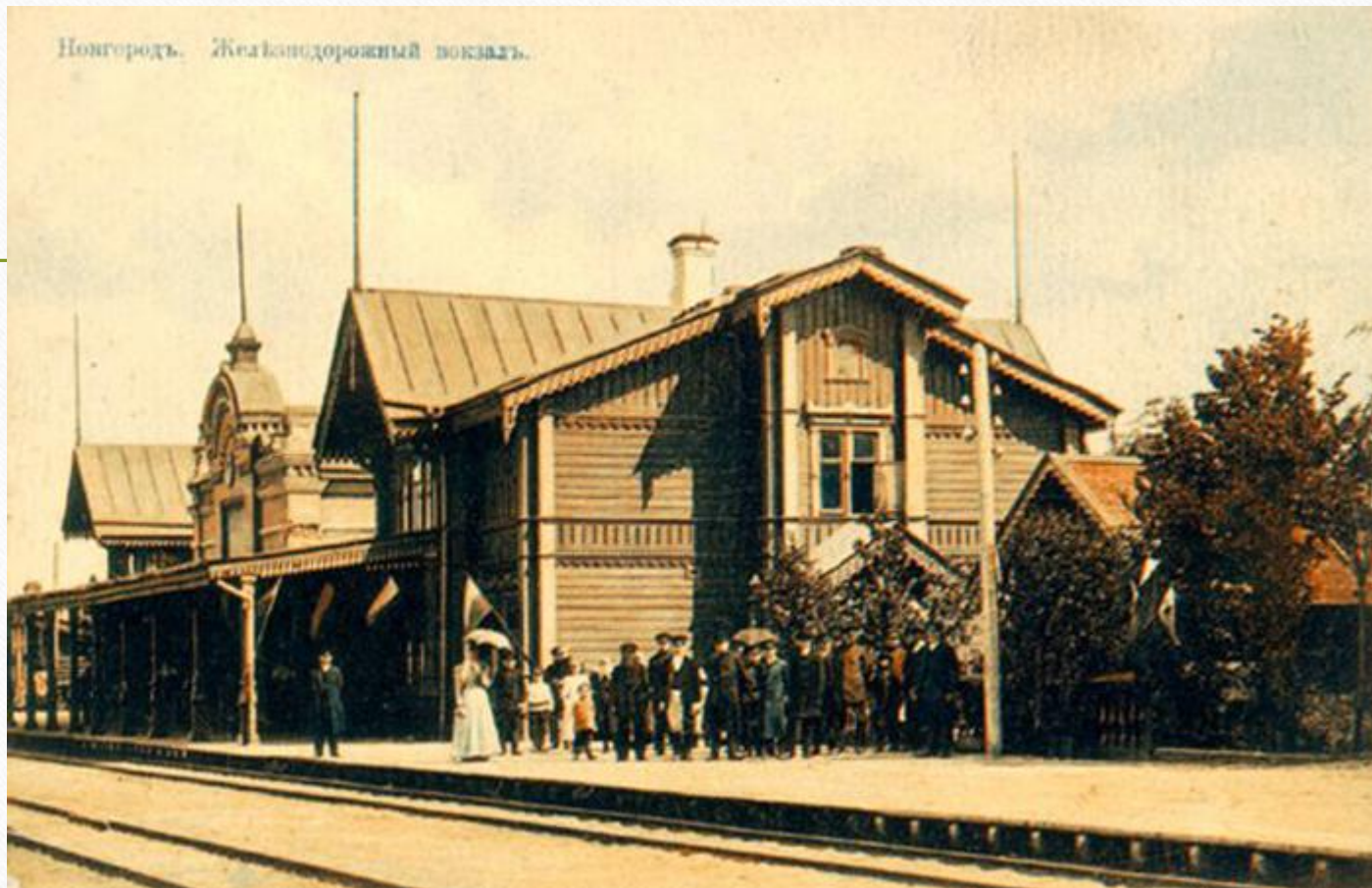
Новгородъ. Железнодорожный вокзалъ.