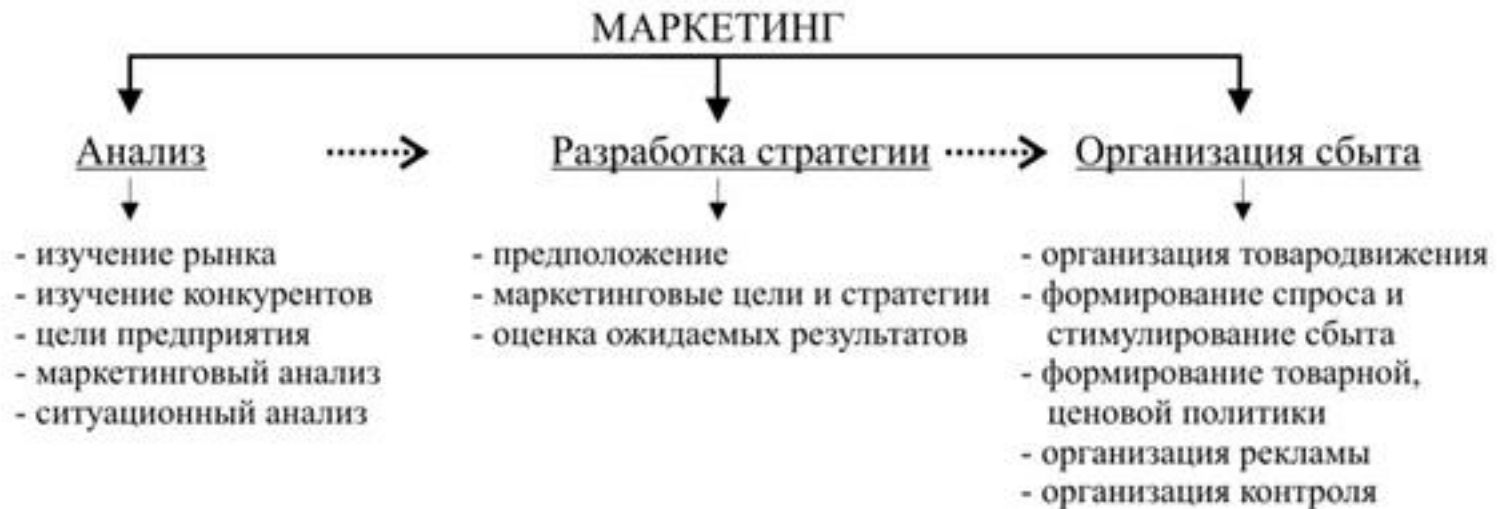
Схема 1. Структура процесса маркетингового исследования