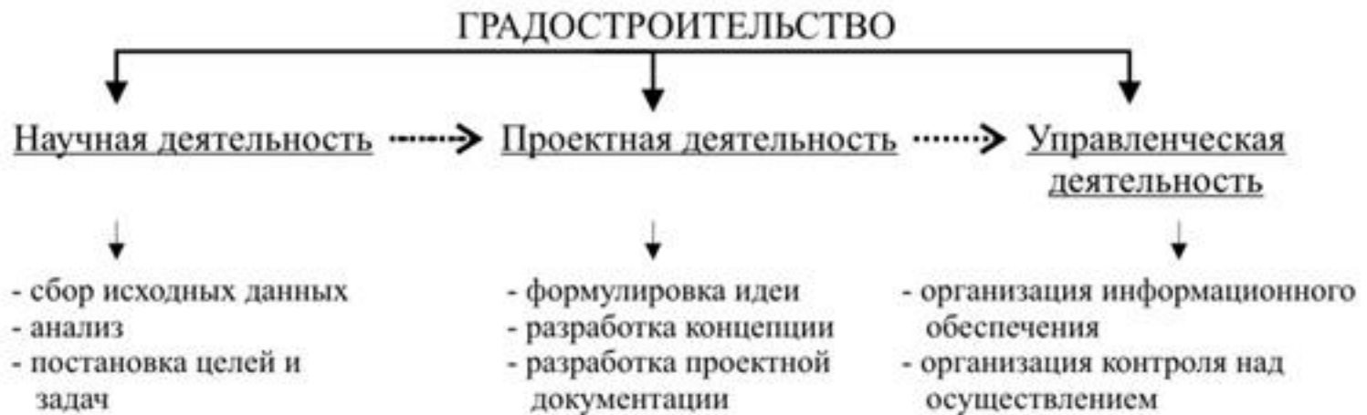
Схема 2. Структура процесса градостроительства как системы