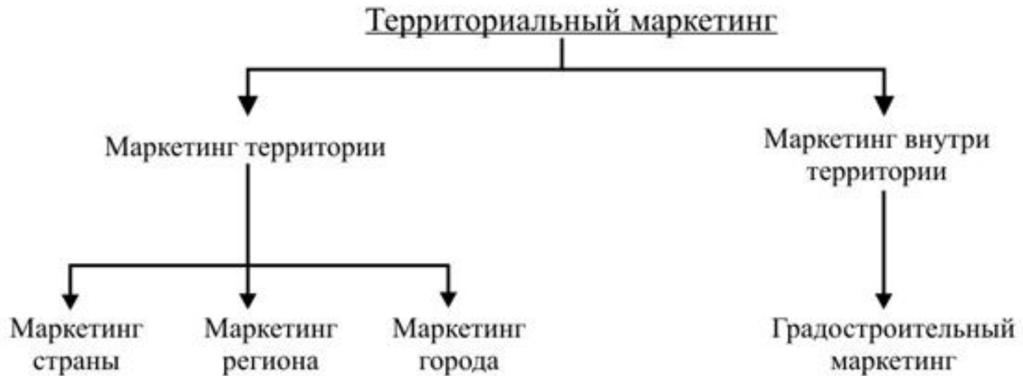
Схема 4. Градостроительный маркетинг как часть территориального маркетинга