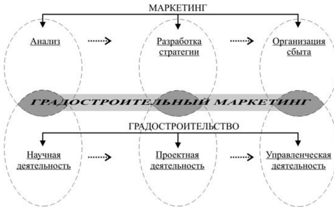
Схема 3. Взаимодействие структур маркетинга и градостроительства