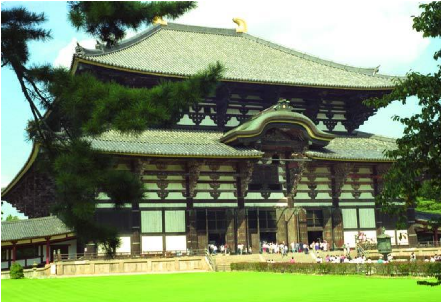
Монастырь Тодайдзи. Зал Большого Будды