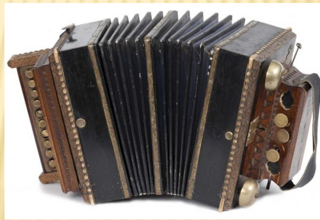
Саратовская – с колокольчиками