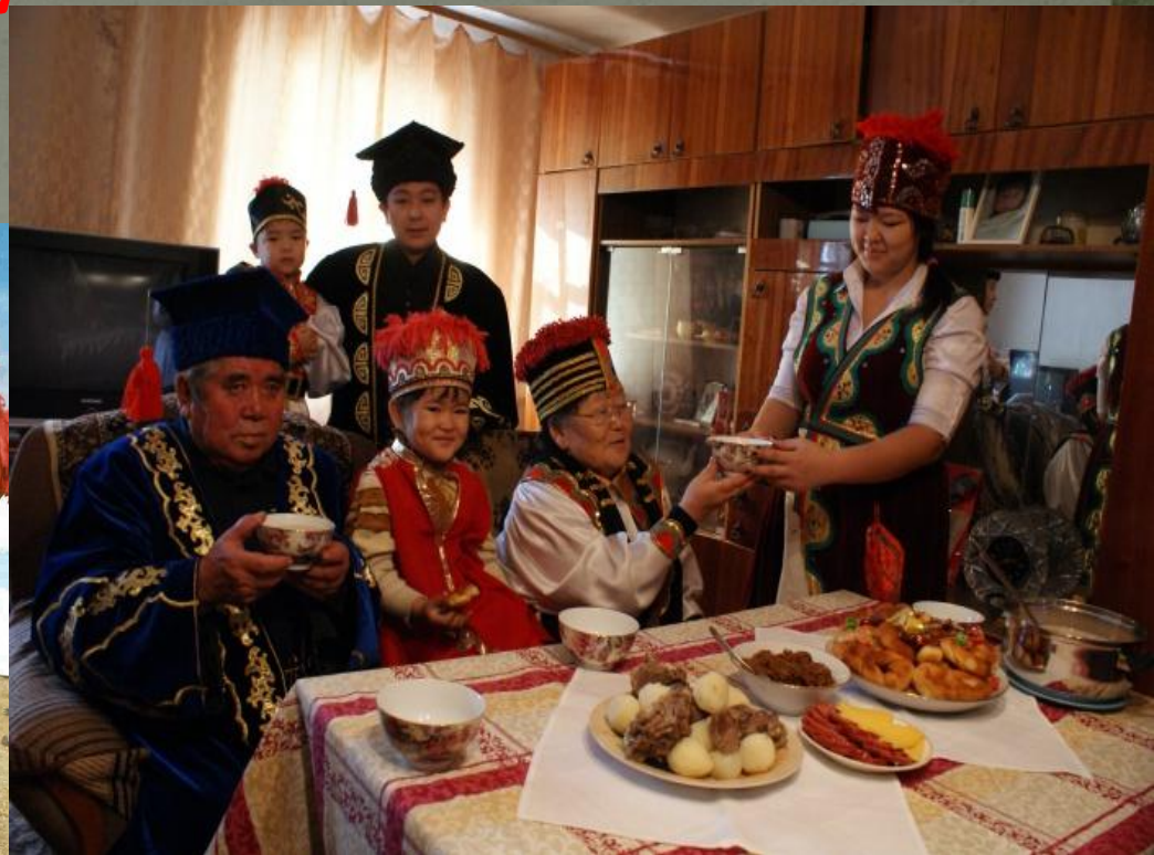
Калмыки делают водку - араку