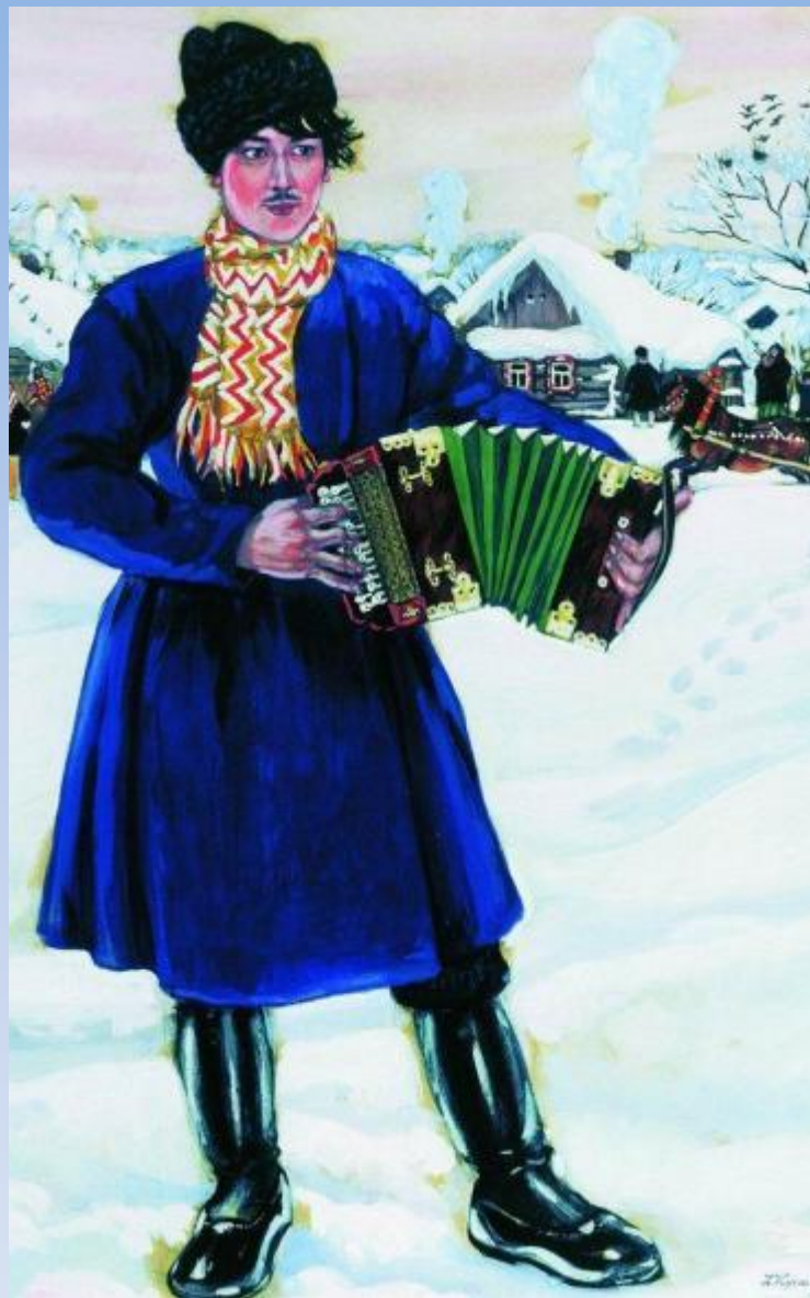
Деревенская масленица (Гармонист).1916