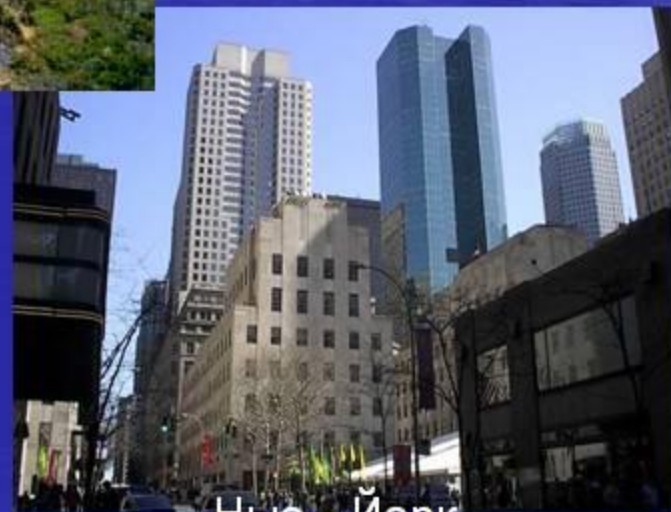
Нью - Йорк