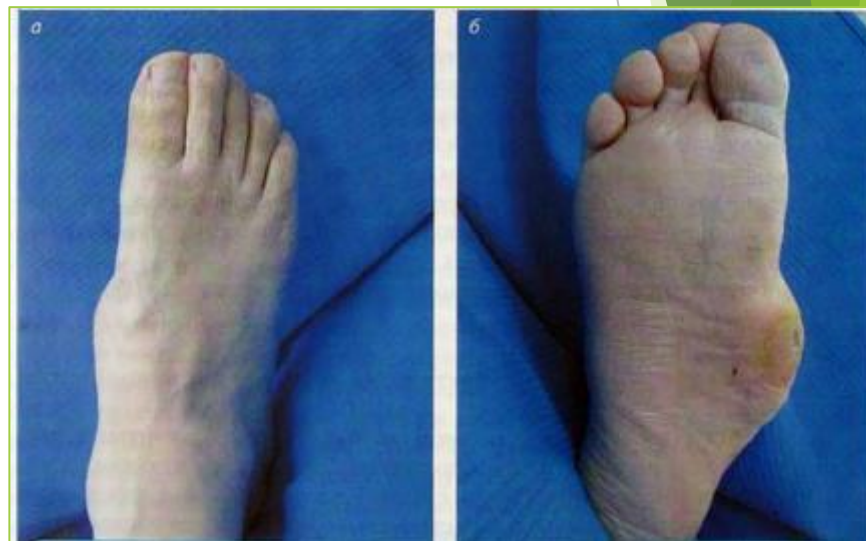
Диабетическая остеоартропатия (стопа Шарко)