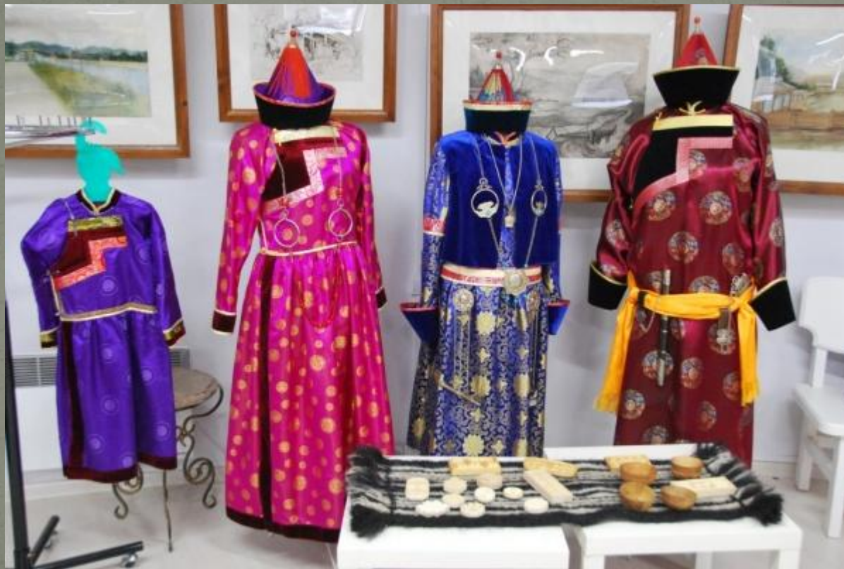
Традиционные костюмы бурят

Основу духовной культуры бурят составляет комплекс духовных ценностей, относящихся в целом к культуре монгольского этноса. В условиях, когда в течение долгих веков население Прибайкалья испытывало на себе влияние многих народов Центральной Азии, а позже и с пребыванием в составе России, в силу того, что Бурятия оказалась на стыке двух систем культуры — западно-христианской и восточно-буддийской — культура бурят как бы трансформировалась, оставаясь по виду прежней.