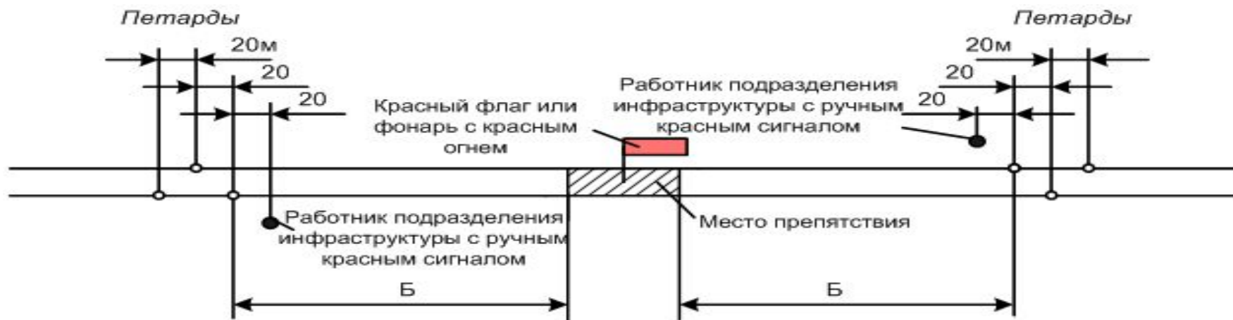
Схема ограждения мест внезапно возникшего препятствия для движения поездов.

Если на сигнал тревоги явится работник ж.д. транспорта, то после установки сигнала остановки на месте препятствия они идут укладывать петарды на расстоянии «Б» и далее остаются у петард в ожидании поезда.