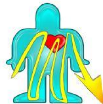
Полная, W-образная петля прохождения тока