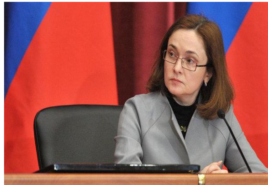
Председатель Центрального банка РФ Набиуллина Э. С.