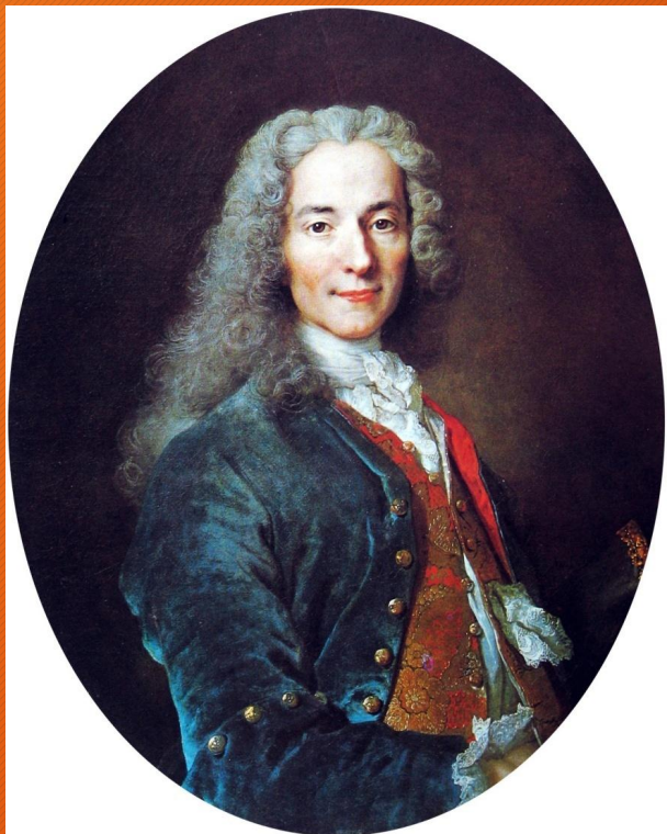
Франсуа-Мари Аруэ Вольтер