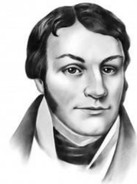
Григорій Квітка-Основ'яненко (1778—1843)