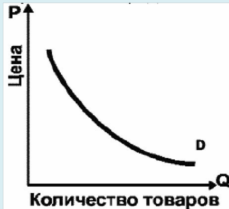
Рис. 4. Кривая спроса

Зависимость между ценой ( P ) и величиной спроса ( Q ) можно изобразить графически, она будет иметь вид кривой спроса D (рис. 4).