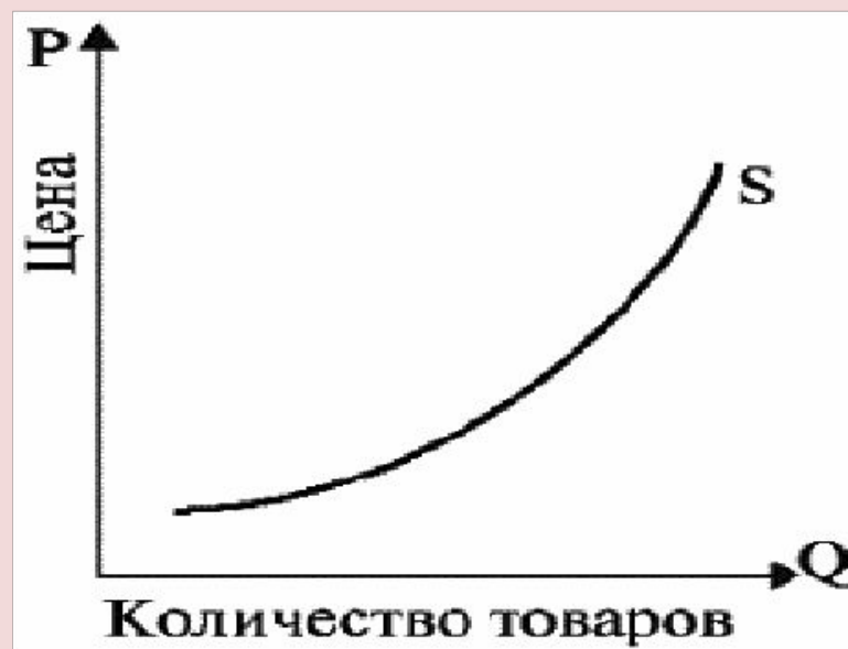
Рис. 5. Кривая предложения

Графическая зависимость между ценой и объемом предложения получила название кривой предложения S (рис. 5).