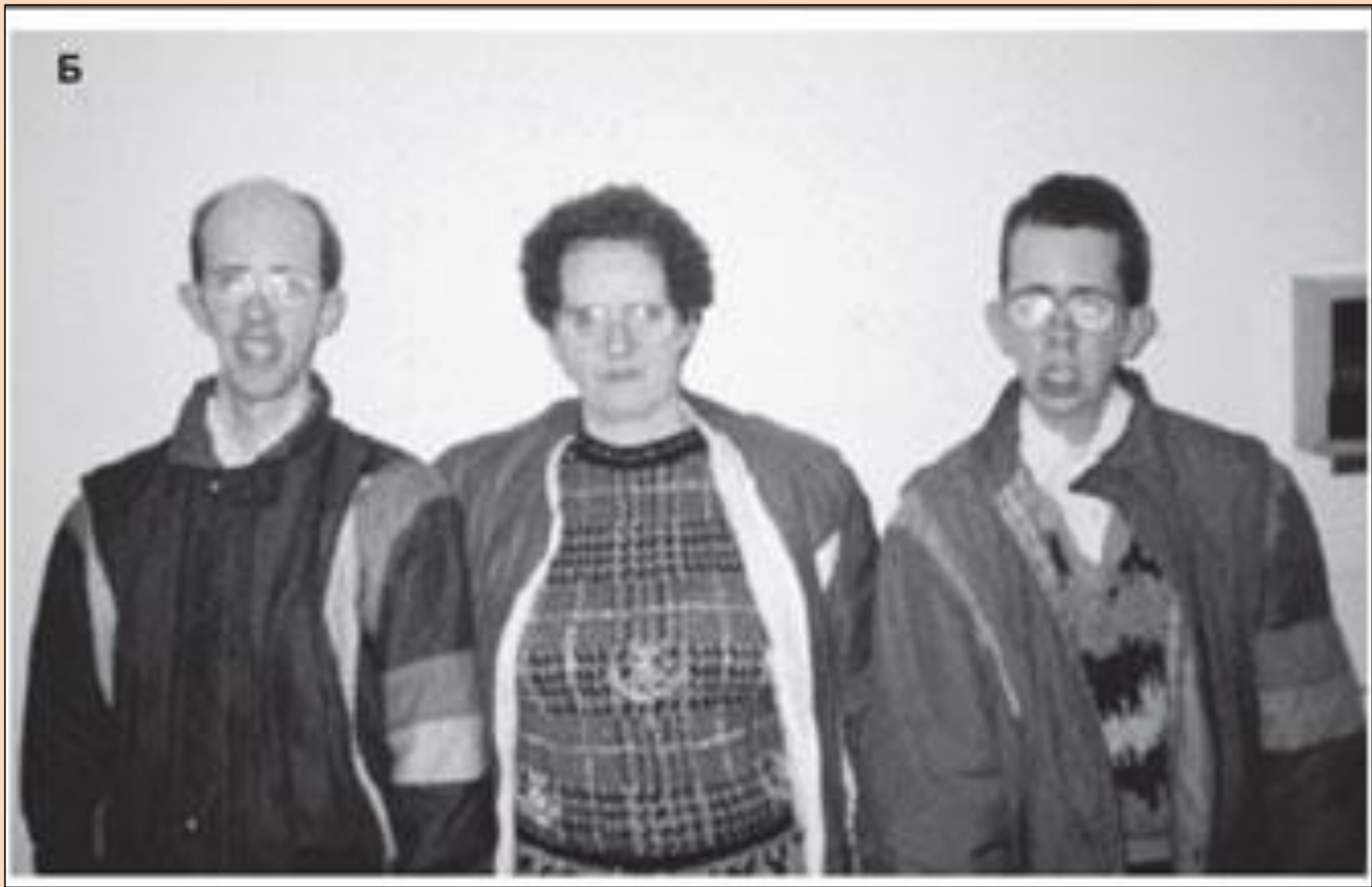
Мать с двумя сыновьями (17 и 15 лет) больными конгенитальной формой дистрофической миотонии 1-го типа