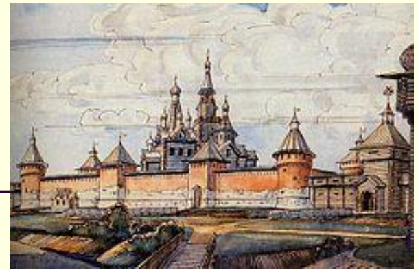
Реконструкция тульского кремля (XVI в.)

10 ноября 2016 года Президент России подписал указ о праздновании в