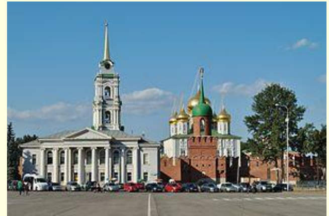
Вид на башню Одоевских ворот и Успенский собор

Деревянный сруб, начинаясь в районе нынешнего Зареченского моста от Никольских ворот, шёл по Советской улице до Крапивенской башни, имевшей форму шестиугольной призмы. Крапивенская башня стояла на пересечении нынешних улицы Советской и проспекта Ленина. Здесь дубовая стена примыкала к древнему земляному валу, шедшему от крапивенских ворот по Завальской улице (сейчас тоже Советская) и оканчивавшемуся у самого берега Упы Никитскими воротами. Отсюда вновь начиналась дубовая стена и шла вдоль всего берега до Никольских ворот.