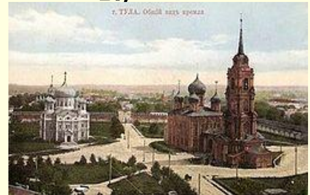
Кремль в начале XX в.