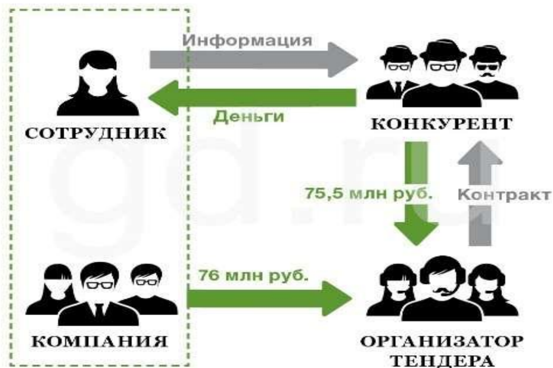
РИСУНОК 2 СХЕМА «БОЛТУН – НАХОДКА ДЛЯ КОНКУРЕНТА»