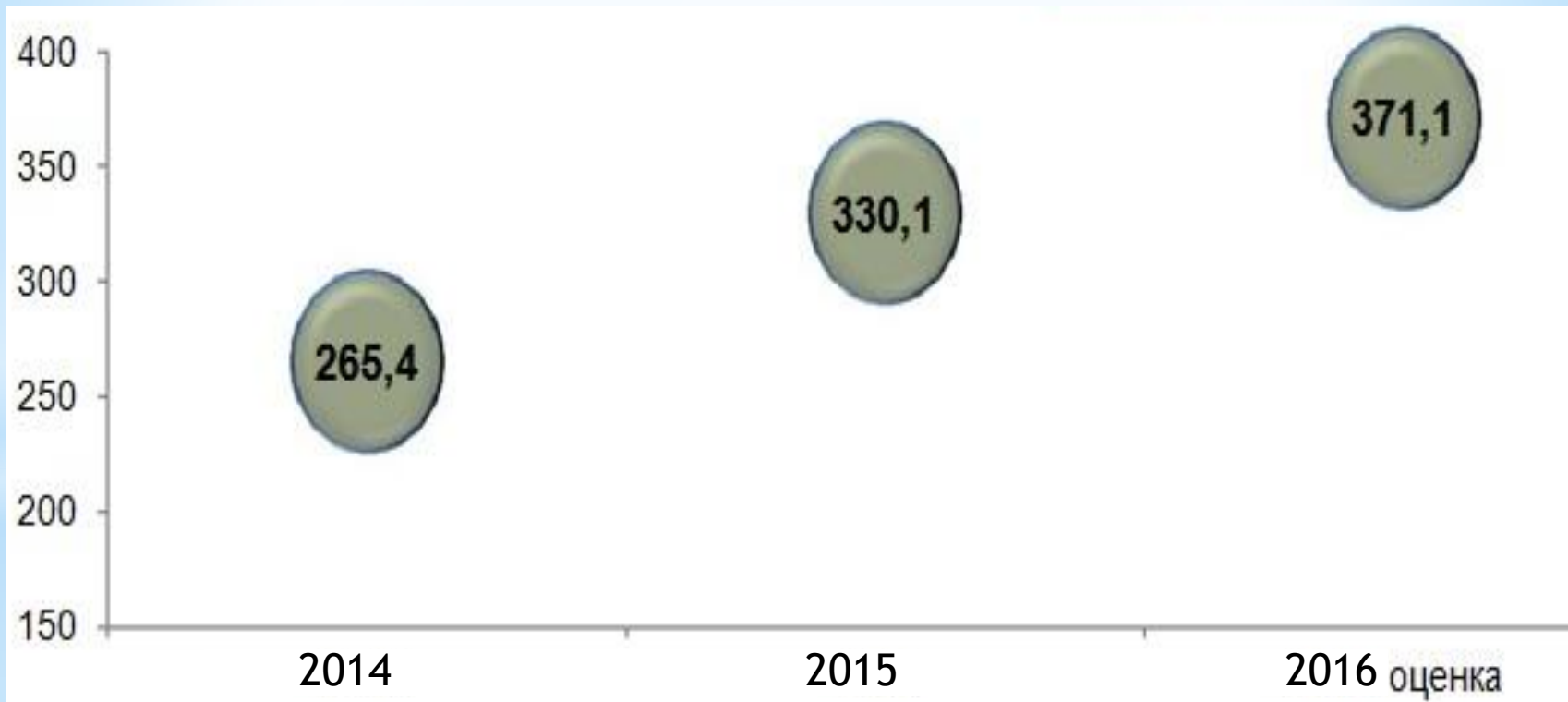
Диаграмма 2. Валовой региональный продукт на душу населения, тыс. рублей.