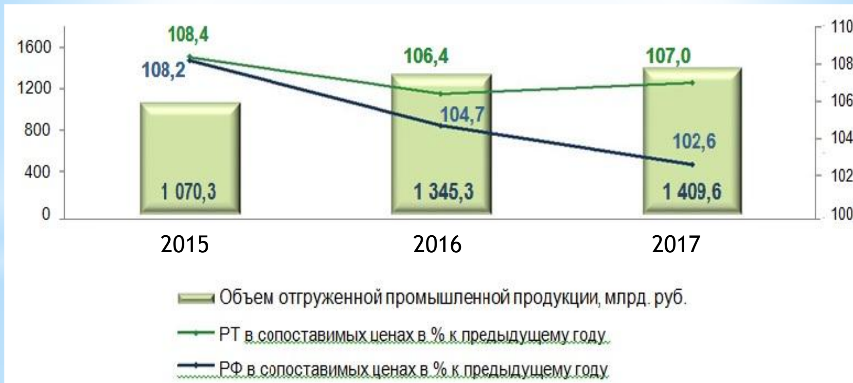
Диаграмма 3. Динамика промышленного производства.