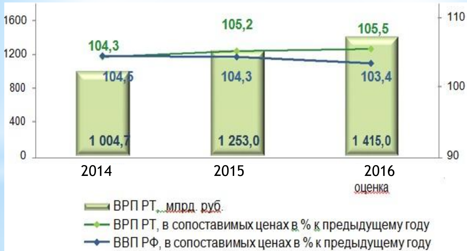
Диаграмма 1. Динамика ВРП Республики Татарстан и ВВП Российской Федерации.