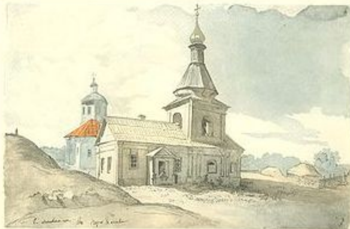
МІХАЙЛІВСЬКА ЦЕРКВА В ПЕРЕЯСЛАВІ. Листопад 1845—січень 1846.