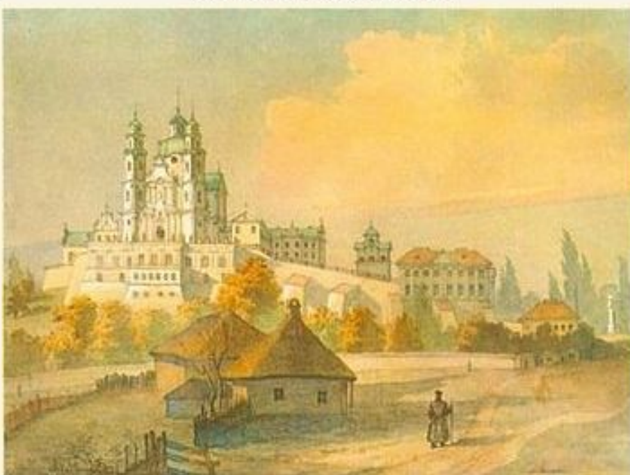
Почаївська лавра з півдня