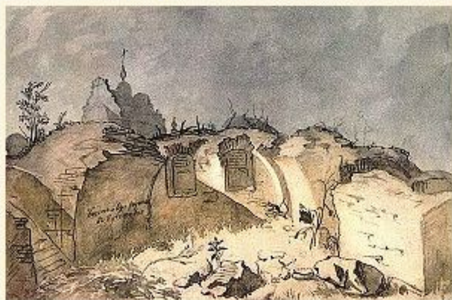
Богданові руїни в Суботові