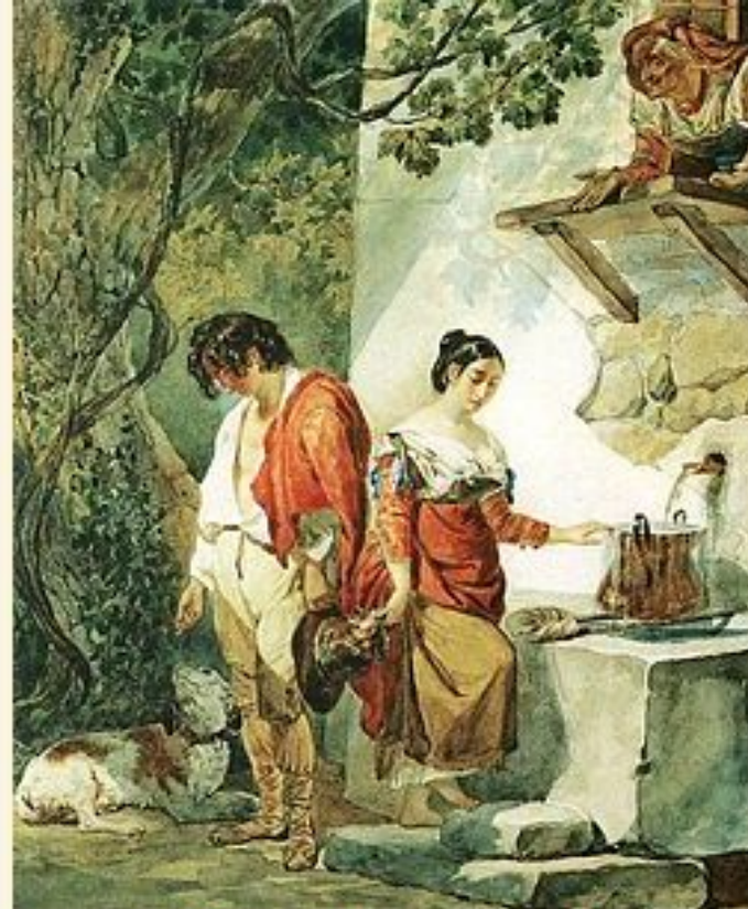
К. Брюллов. «Перерване побачення»